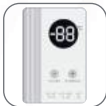
Termostato exterior digital