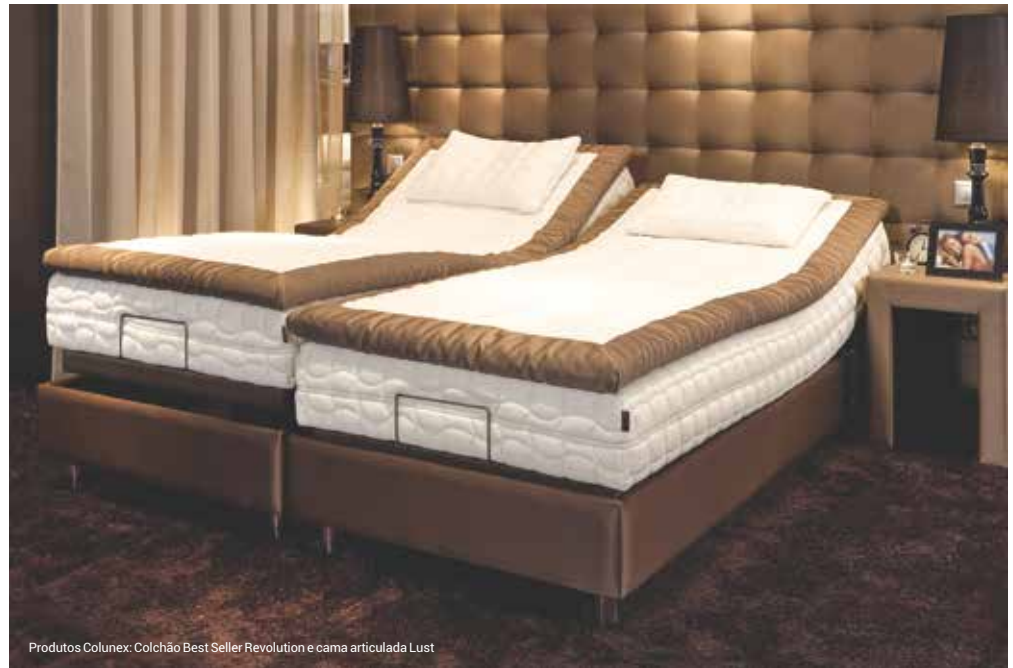
Produtos Colunex: Colchão Best Seller Revolution e cama articulada Lust

A Colunex, empresa orgulhosamente portuguesa, com 28 anos de existência, tornou claro com o seu famoso slogan "Outro sono, outro conforto..." que os seus produtos são distintos pela alta qualidade, elevada durabilidade e design de vanguarda