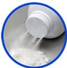
Talc sur les parois internes de la gouttière

Attention : ne pas mettre de la diatomée au centre du piège, mais dans le fond de la gouttière. La zone de capture est effet bordé par deux parois très lisses.