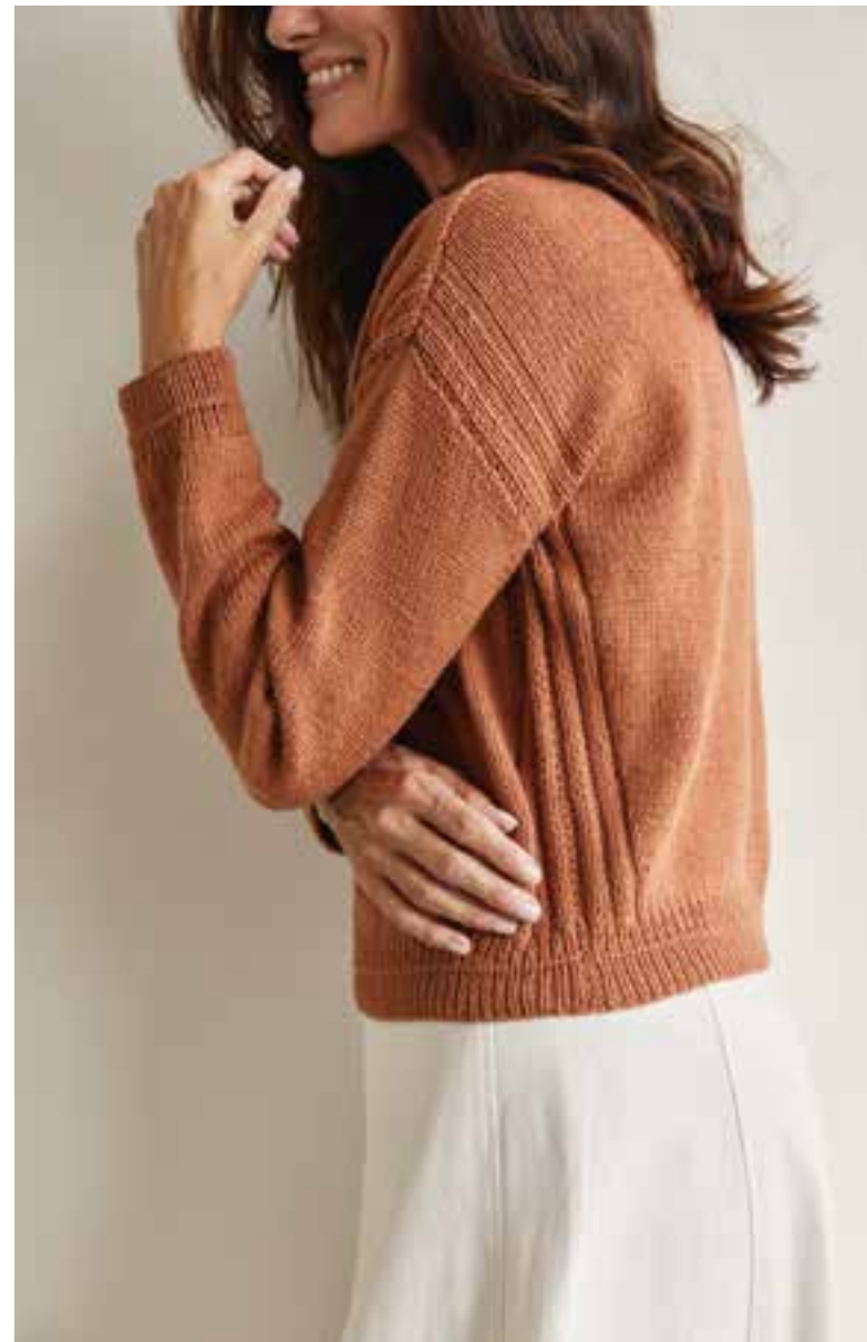
36 – Pullover LANDLUST ALPAKA MERINO 160