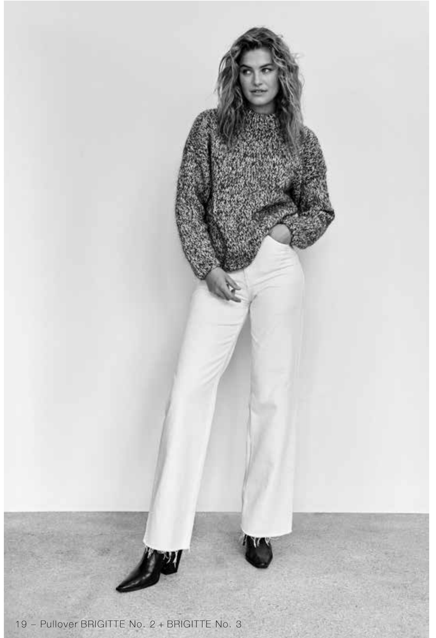
19 – Pullover BRIGITTE No. 2 + BRIGITTE No. 3