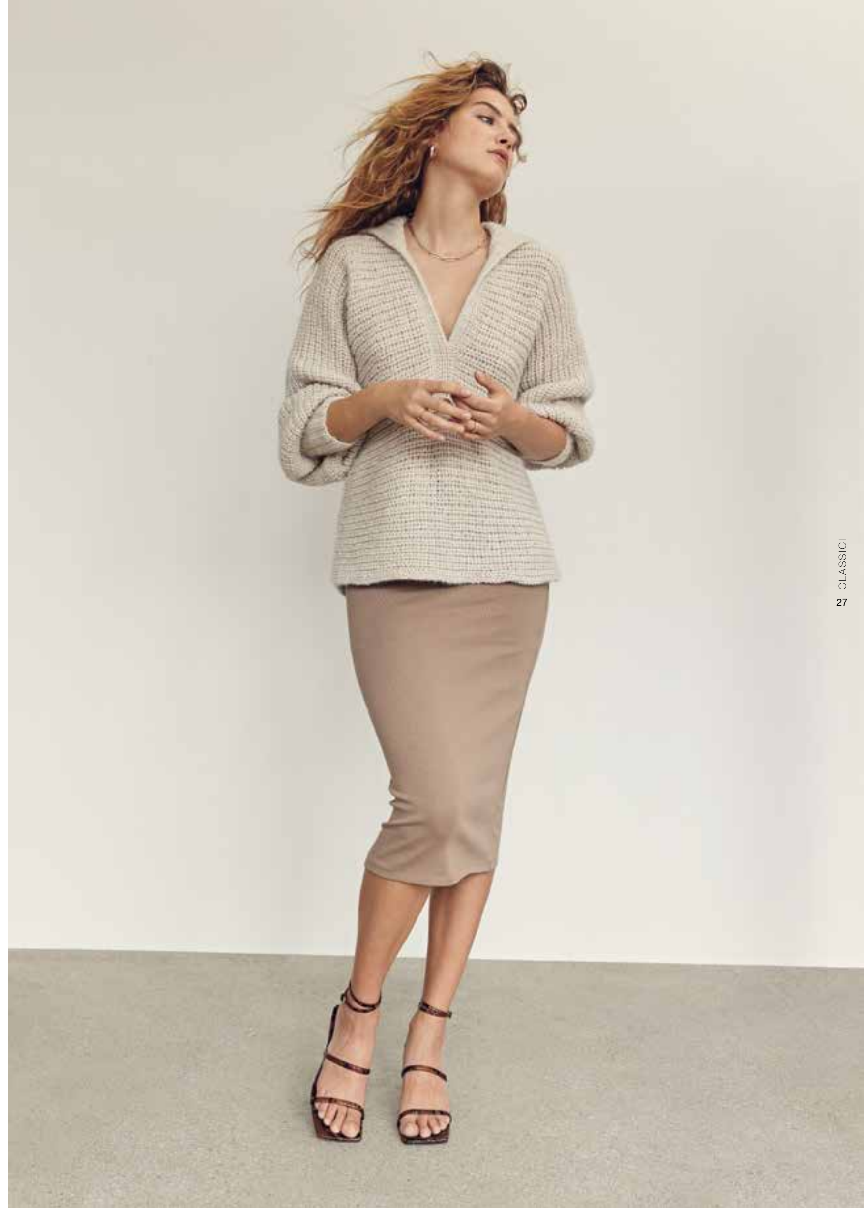
oben: 17 – Pullover ECOPUNO | rechts: 18 – V-Pullover NATURAL ALPACA PELO