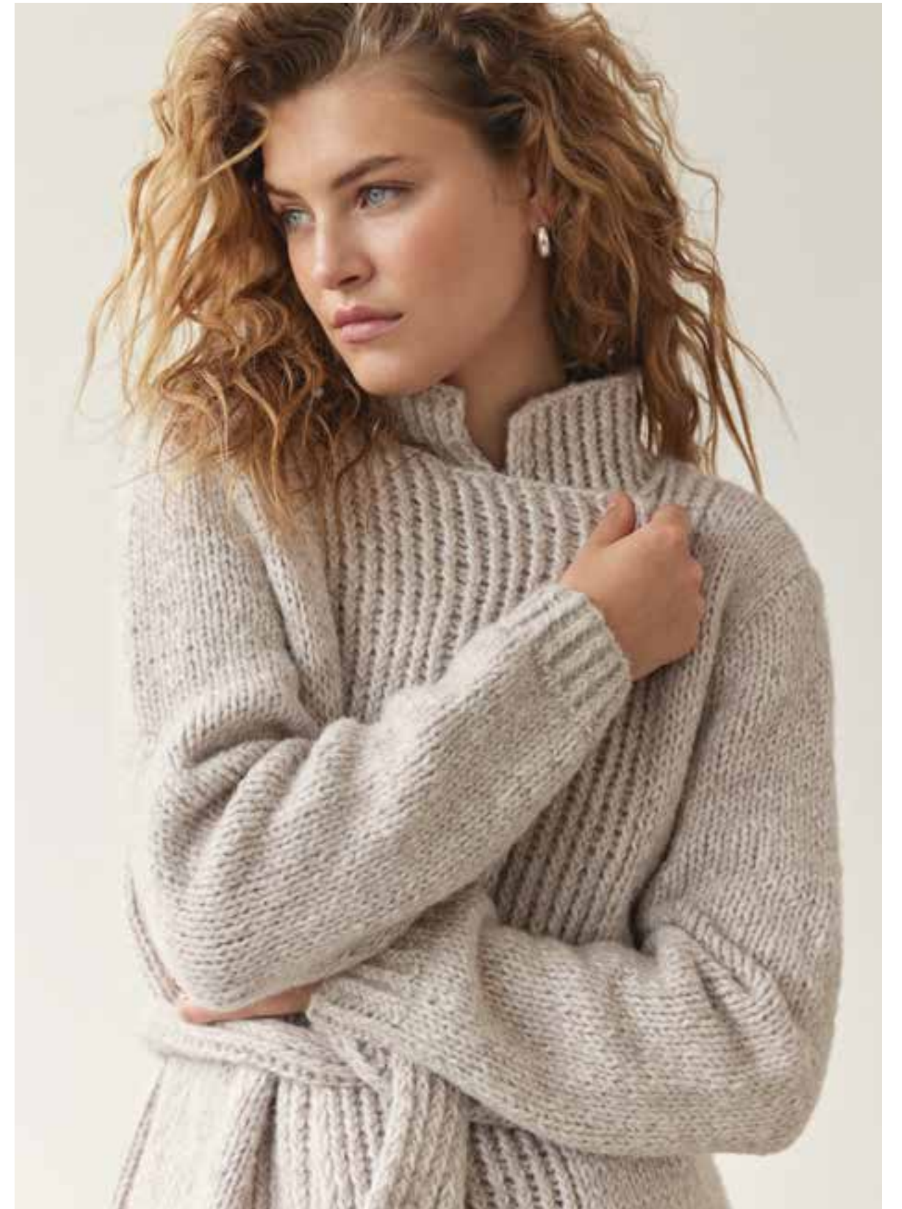
16 – Cardigan ECOPUNO CHUNKY