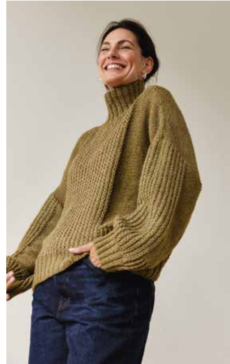
linke Seite: 28 – Pullunder BRIGITTE NO. 2 | oben: 29 – Pullover NEW CLASSIC