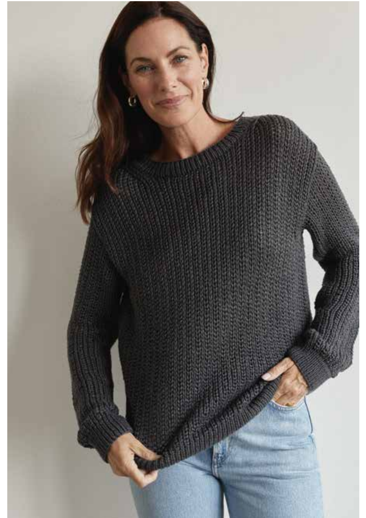
37 – Pullover PURO VEGANO