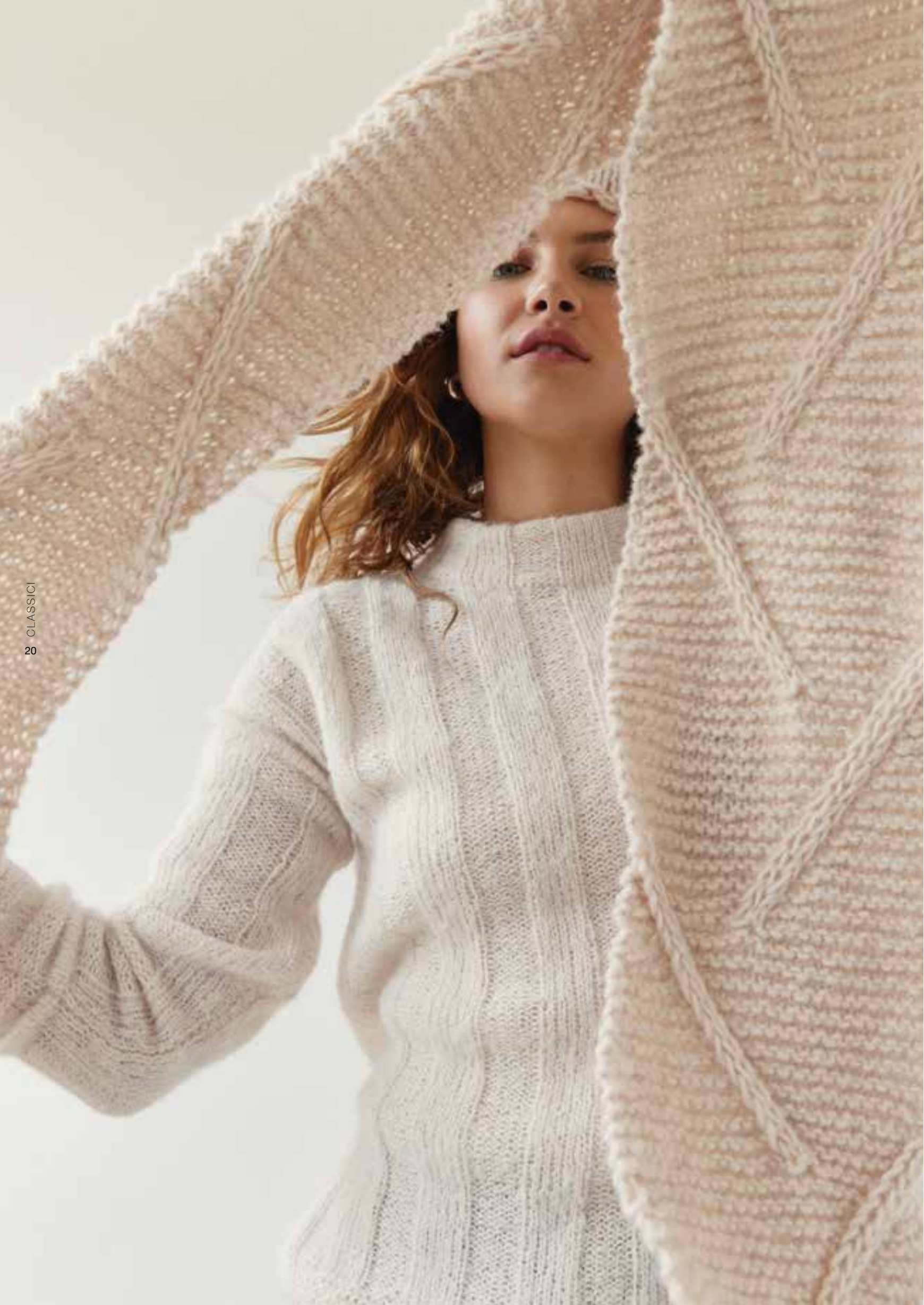
13 + 14 – Mütze und XXL-Schal ECOPUNO CHUNKY, Pullover – SETASURI von Seite 18/19