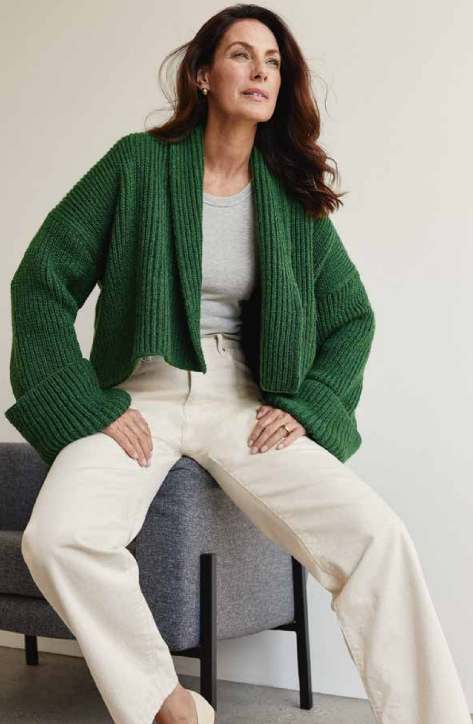
linke Seite: 31 – Cardigan ALTA MODA ALPACA unten: 32 – Jacke LANDLUST ALPAKA MERINO 160