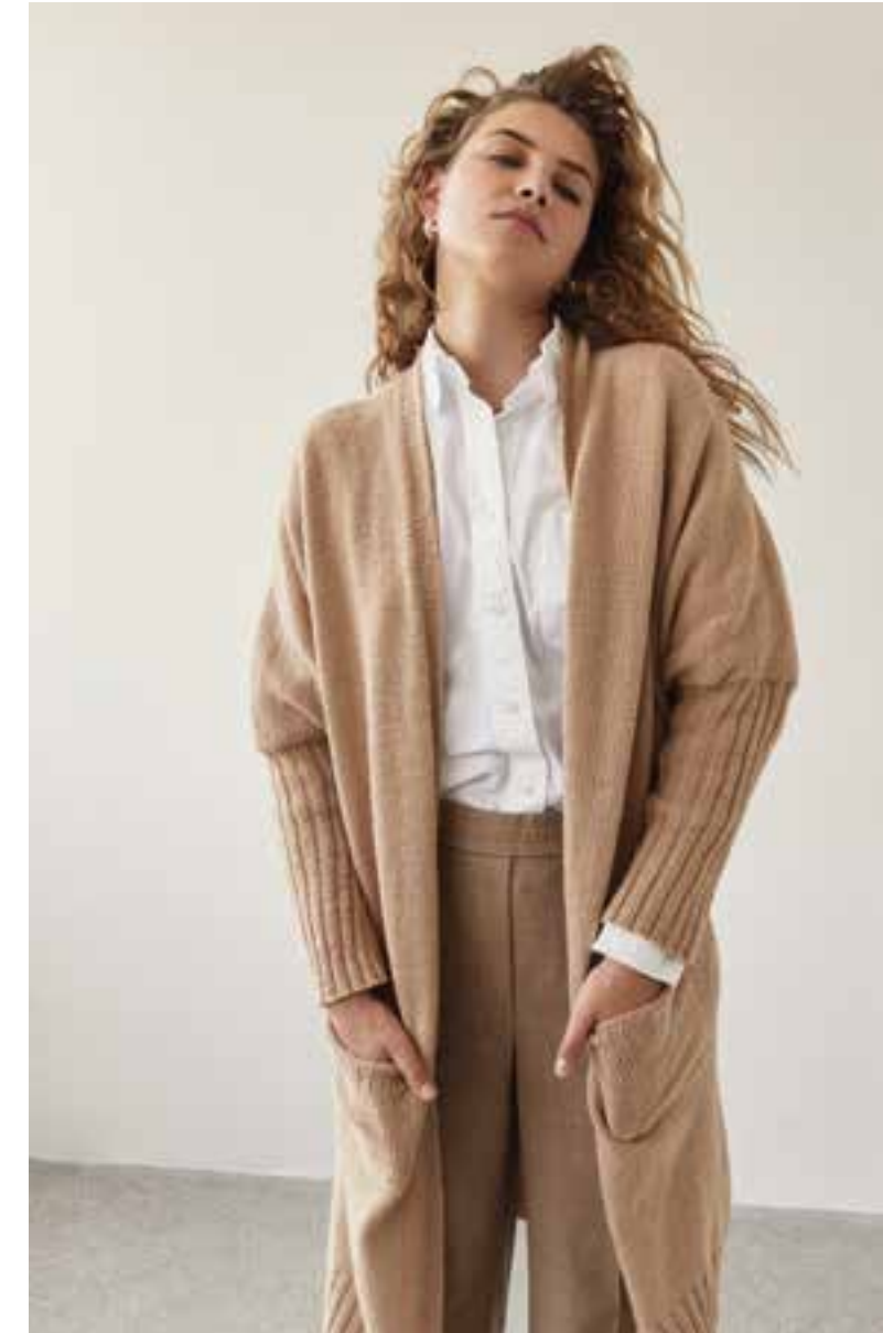
03 – Cardigan LANDLUST ALPAKA MERINO 160