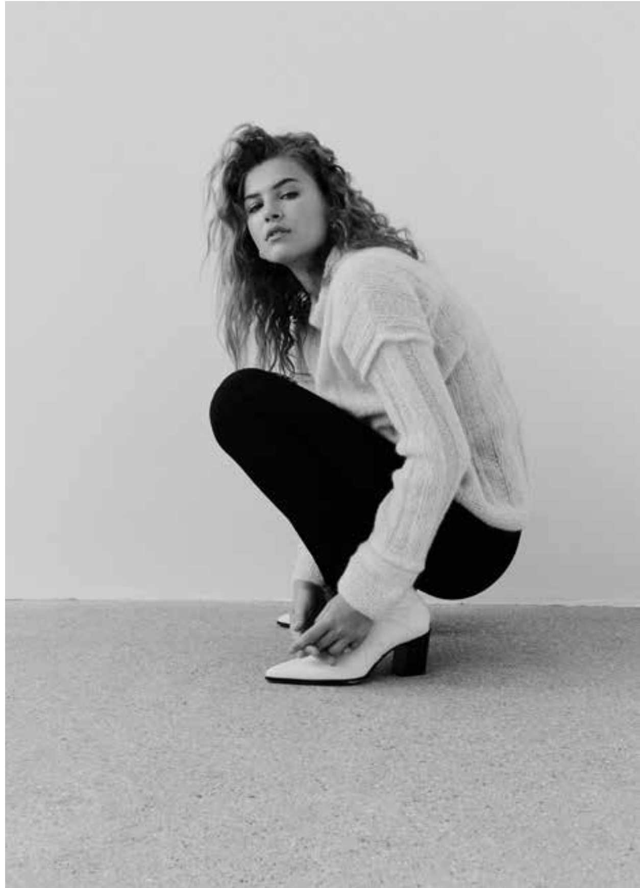
12 – Pullover SETASURI