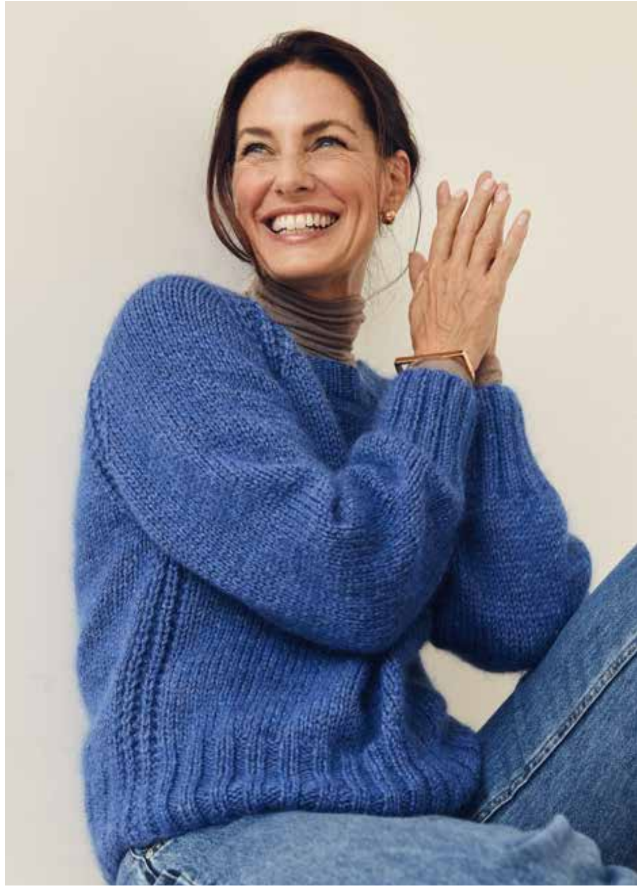
30 – Pullover NEW CLASSIC + SILKHAIR