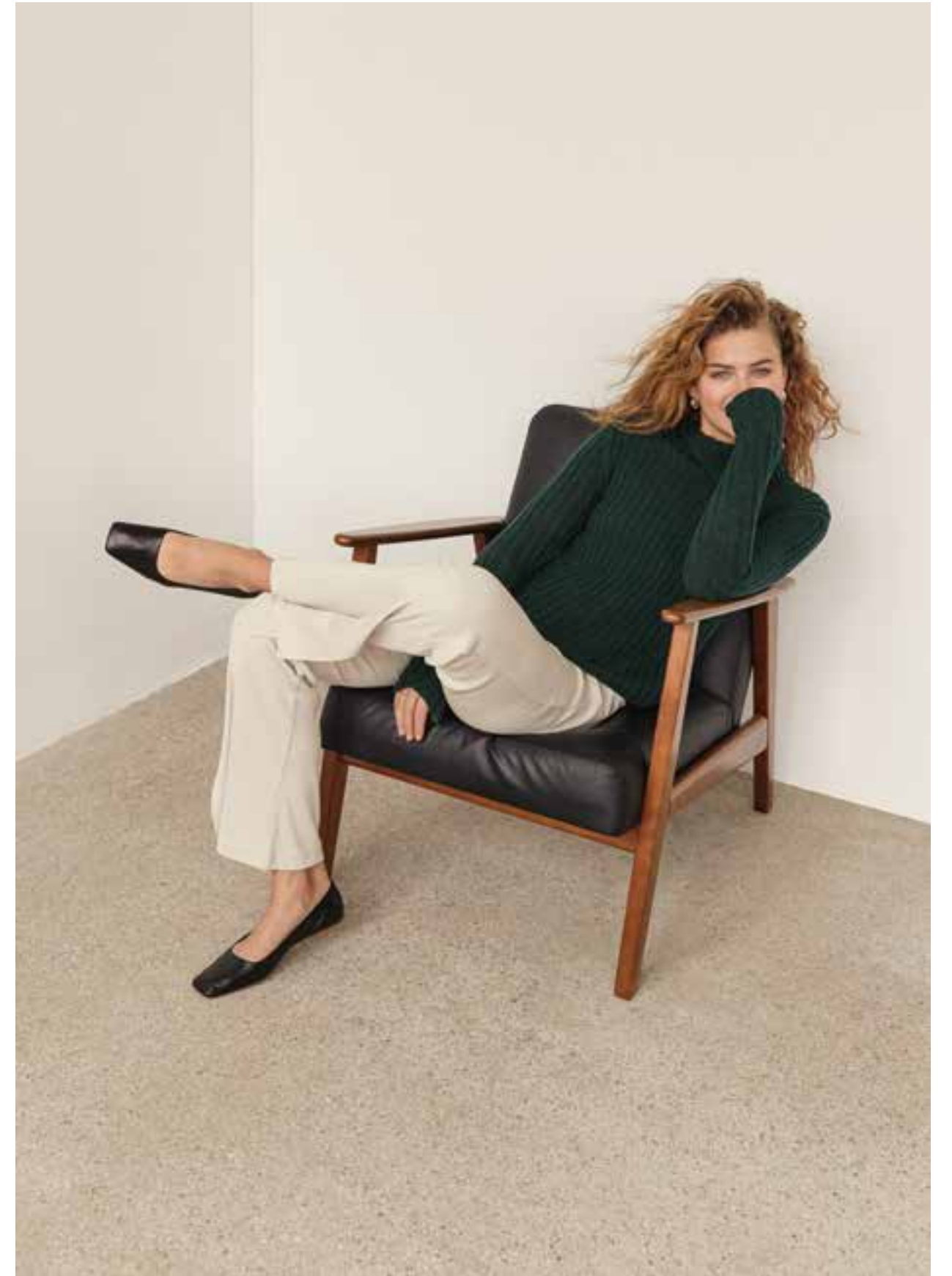
11 – Pullover CASHMERE 16 FINE