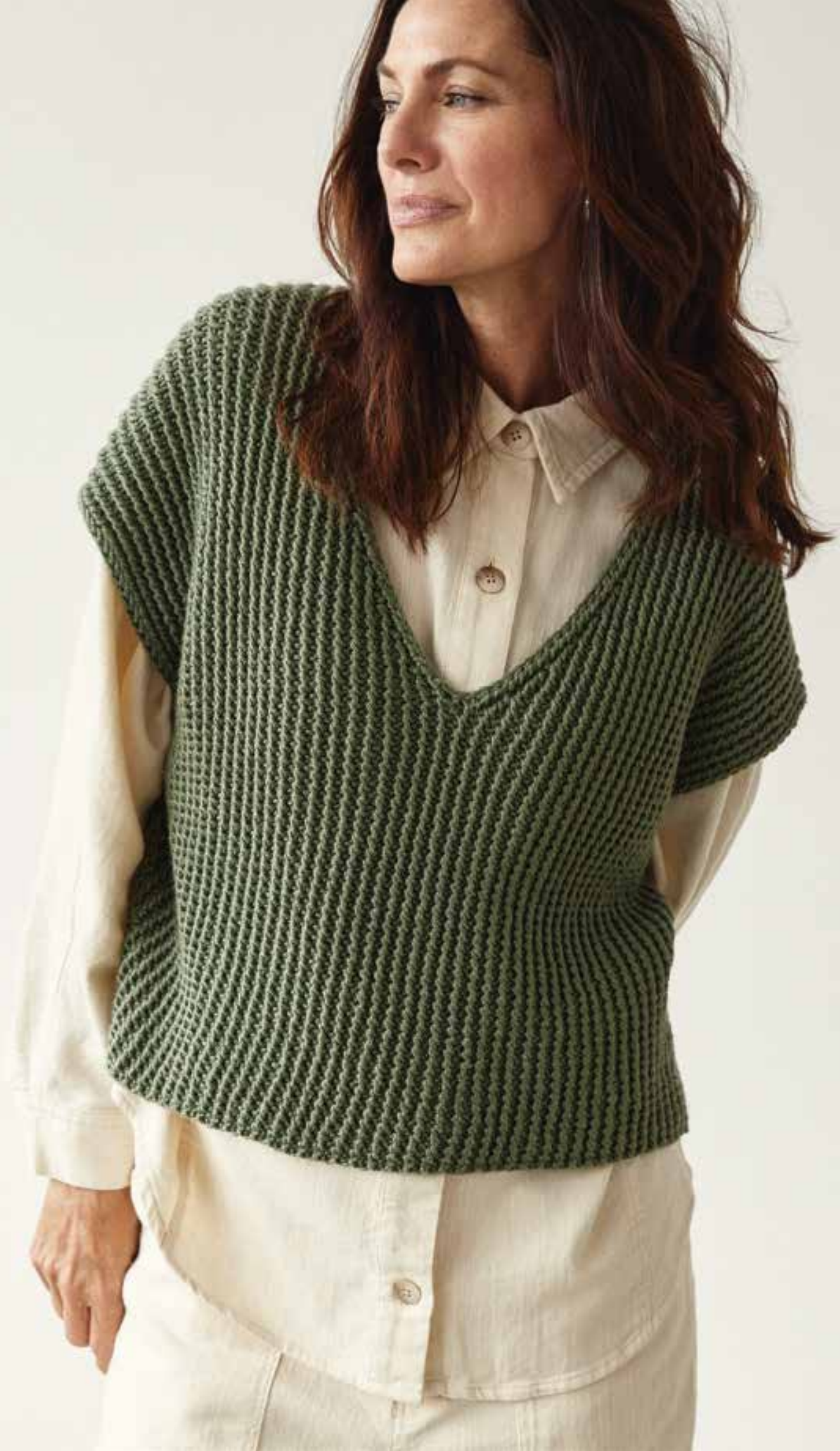
links: 21 – Pullunder PURO VEGANO | unten: 22 – Pullover SETASURI BIG