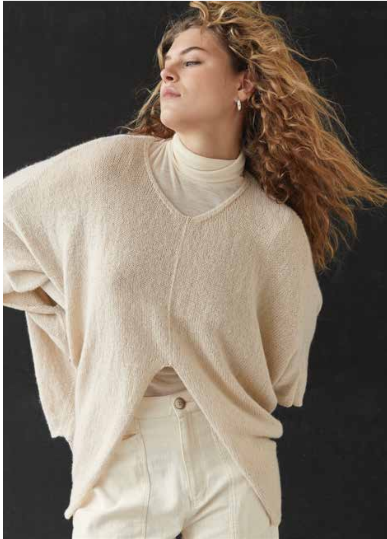
10 – Pullover ECOPUNO