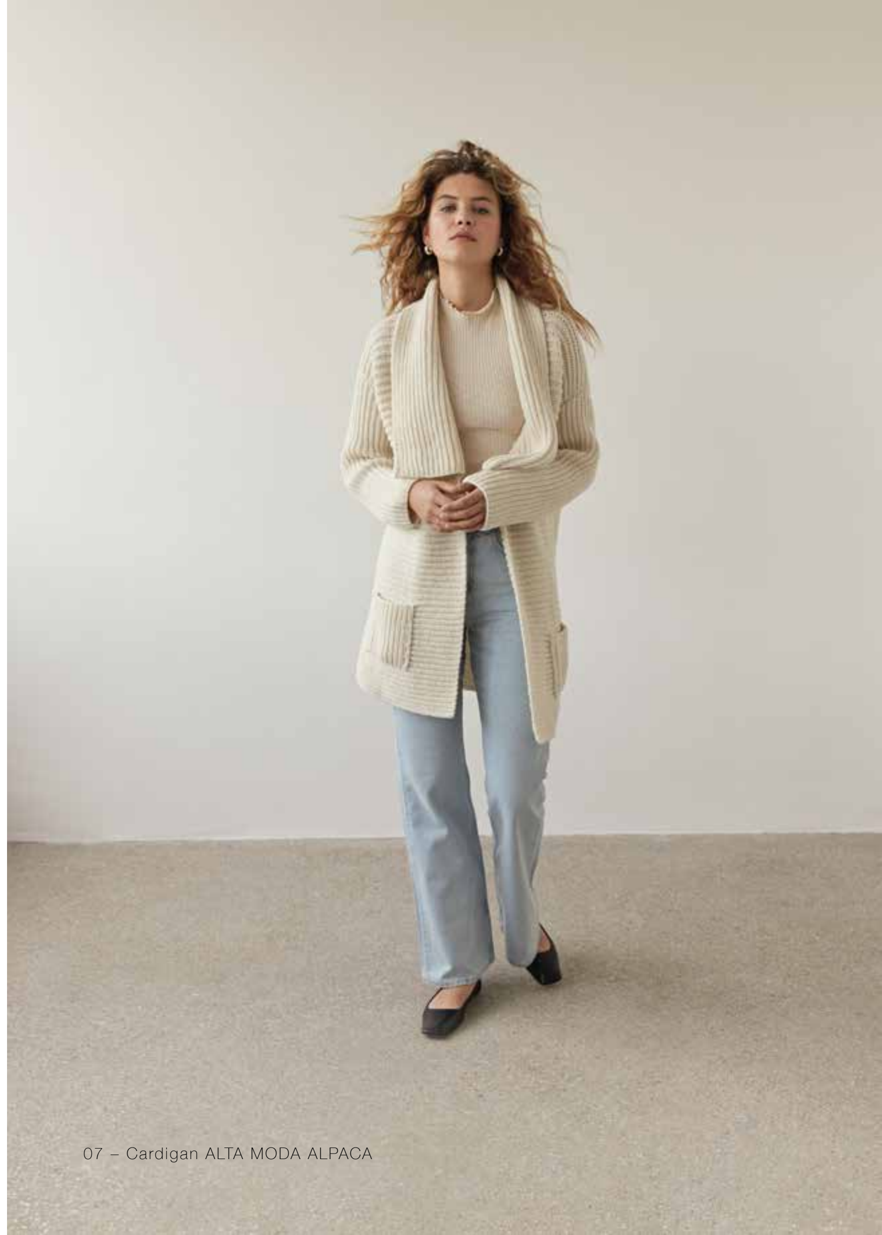
07 - Cardigan ALTA MODA ALPACA