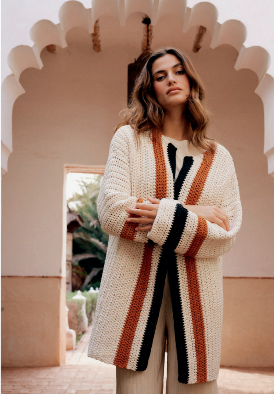
14 · Cardigan mit Kontraststreifen aus THE TUBE FINE .