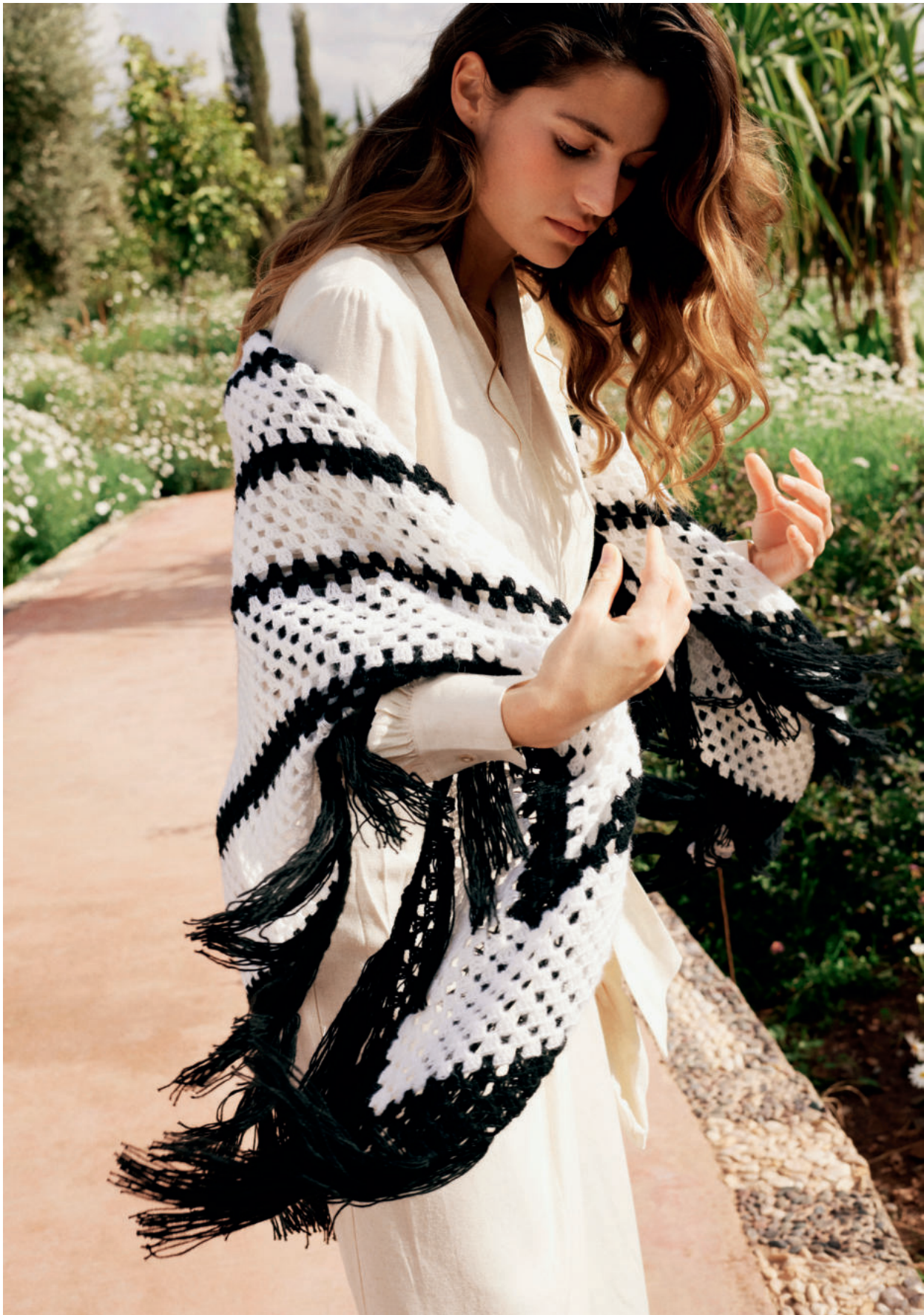
5 · Ein riesengroßes Granny aus ECOPUNO – bei uns als Tuch mit Fransen getragen.