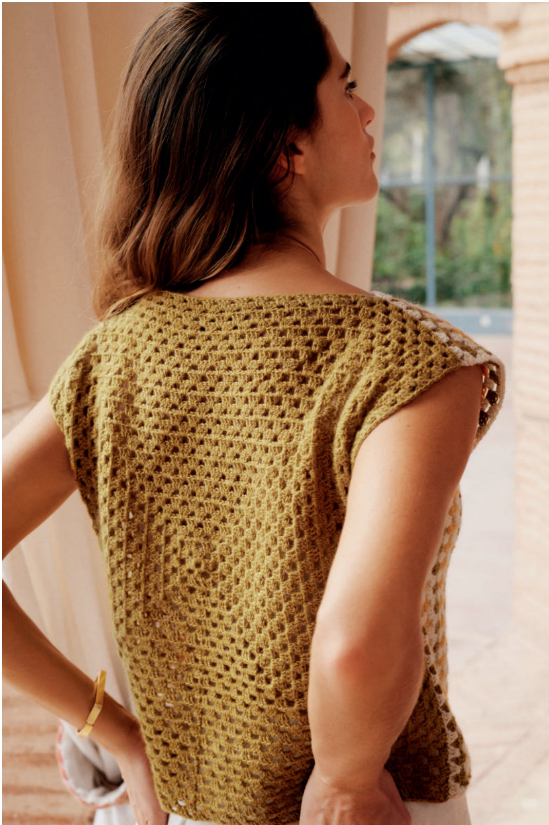
17 · Easy für Einsteiger – Top aus zwei Granny Squares, vorne gemustert, hinten uni – aus ECOPUNO .