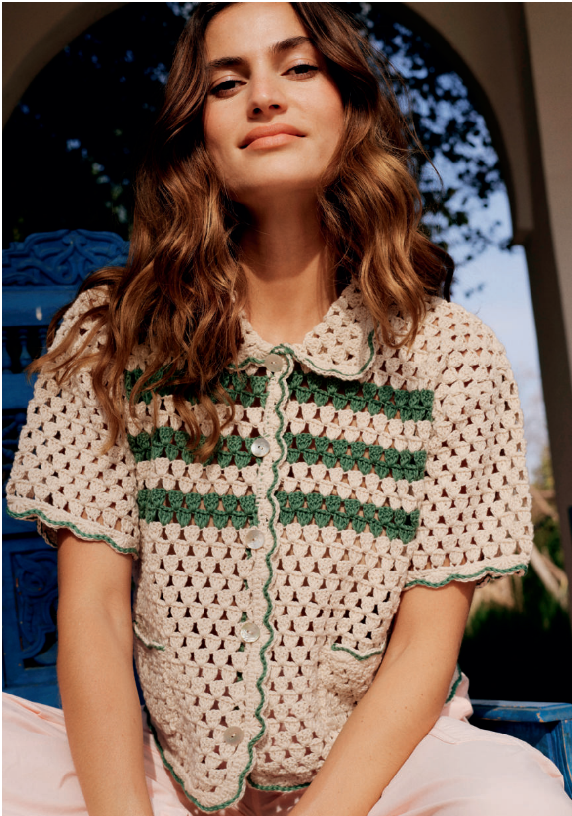
13 · Kurzes Polo-Hemd mit sportlichen Streifen aus LANDLUST BAUMWOLLE .