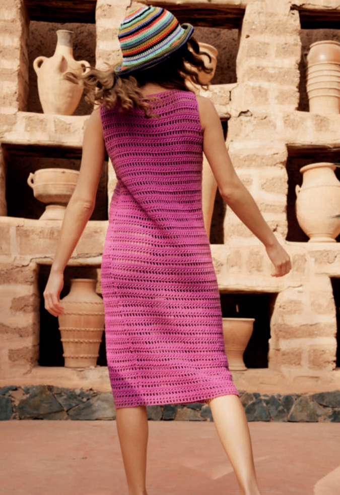
21 · Hut in bunten Ringeln aus ORGANICO .