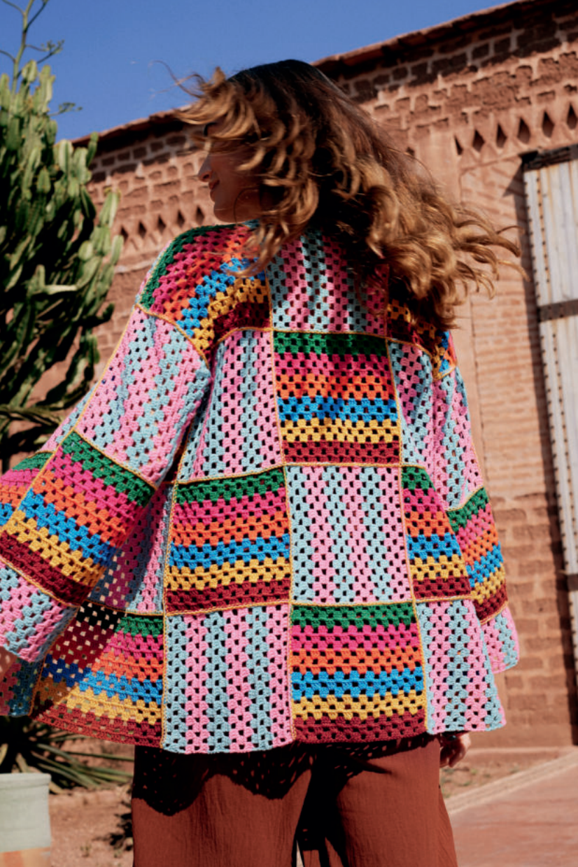
18 · Übergroßer, doppelreihiger Cardigan mit gestreiften Squares für den ultimativen Patchwork-Look aus ELASTICO .