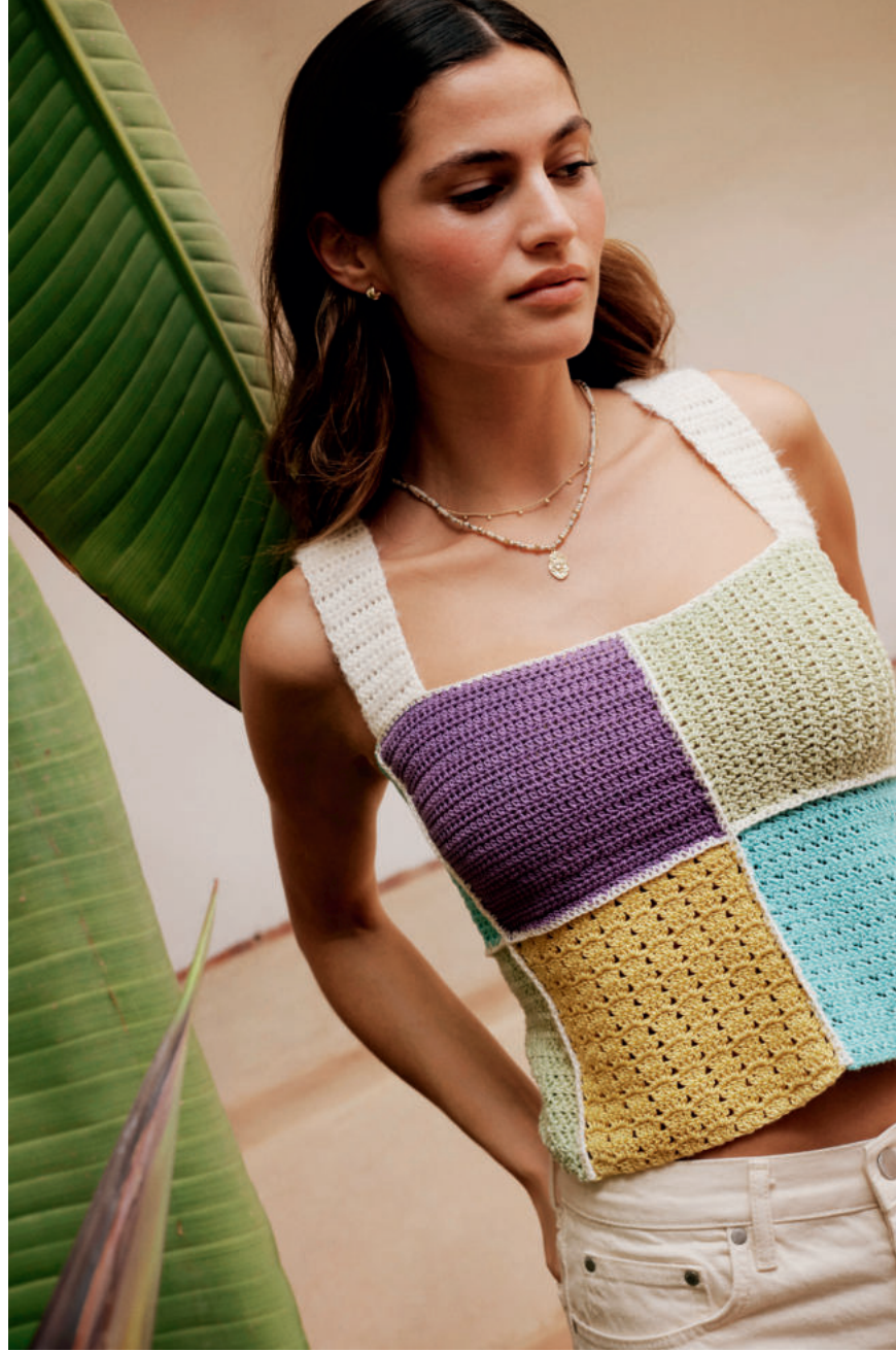
26 · Muster-Patchwork aus SOLO LINO mit Flausch auf den Trägern aus PER FORTUNA .