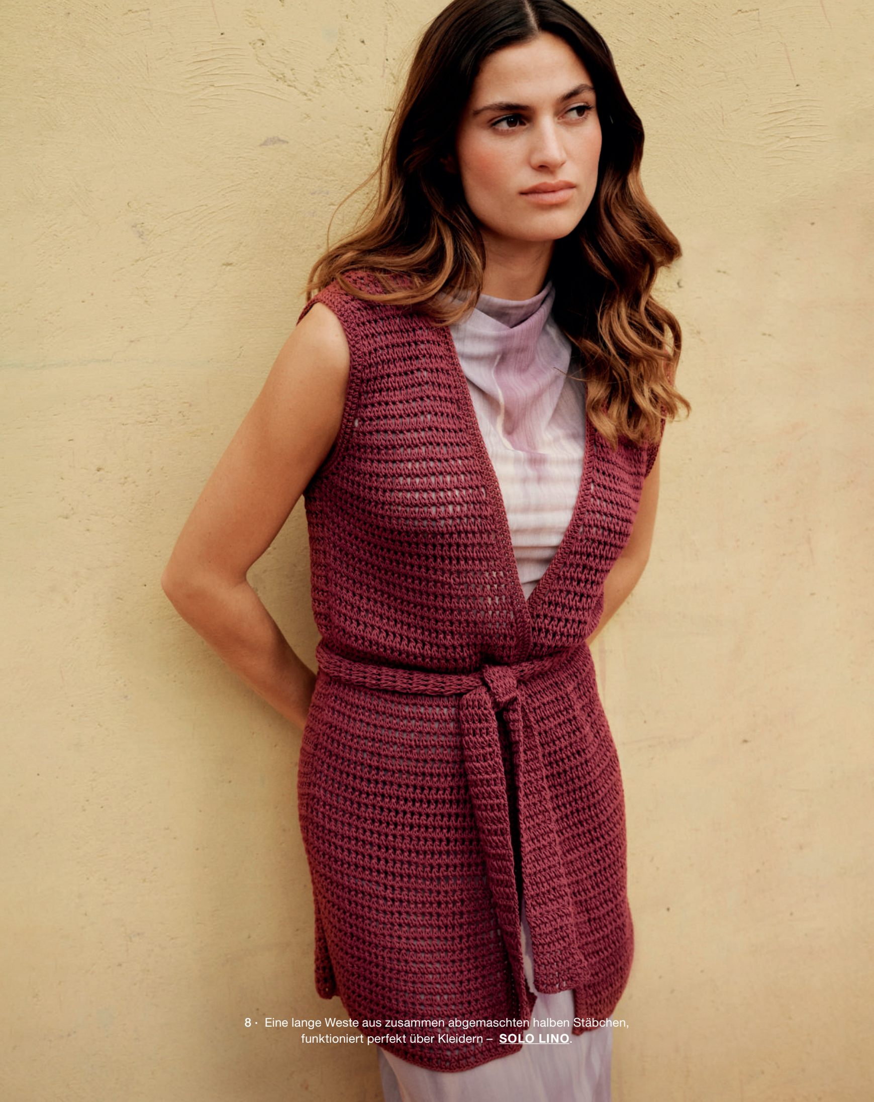
8 · Eine lange Weste aus zusammen abgemaschten halben Stäbchen, funktioniert perfekt über Kleidern – SOLO LINO.