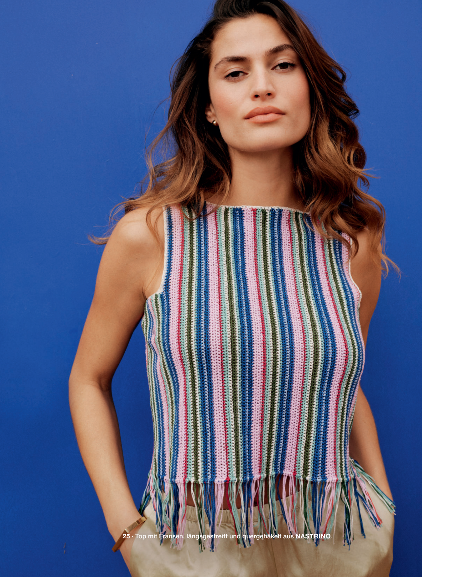
25 · Top mit Fransen, längsgestreift und quergehäkelt aus NASTRINO .