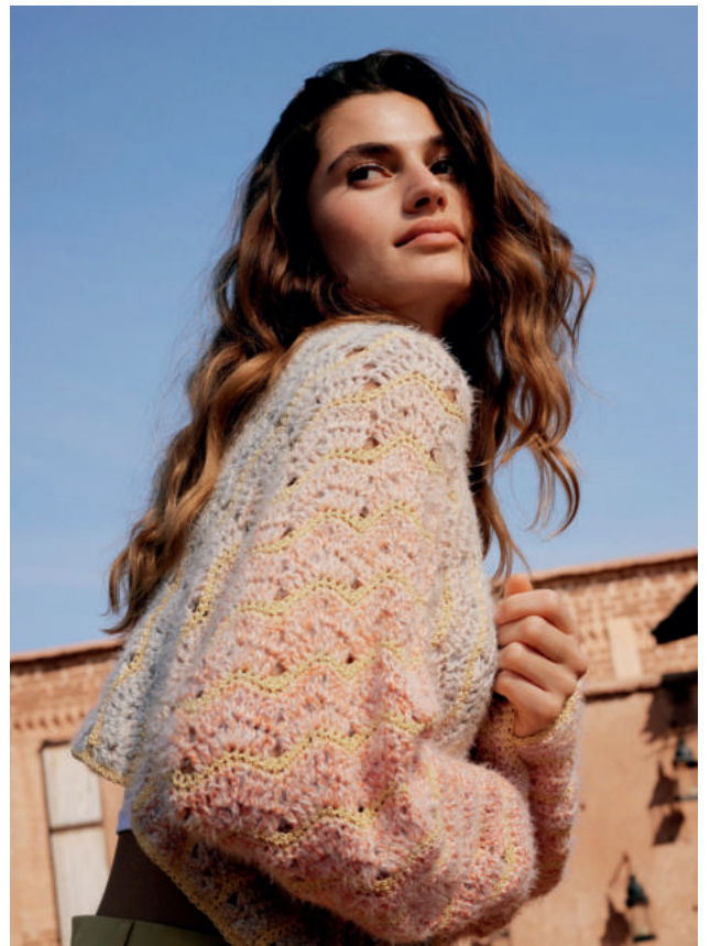
7 · Muster-und Materialmix in pastelligem Farbverlauf aus GOMITOLE SOLE, CAPRI & PER FORTUNA.