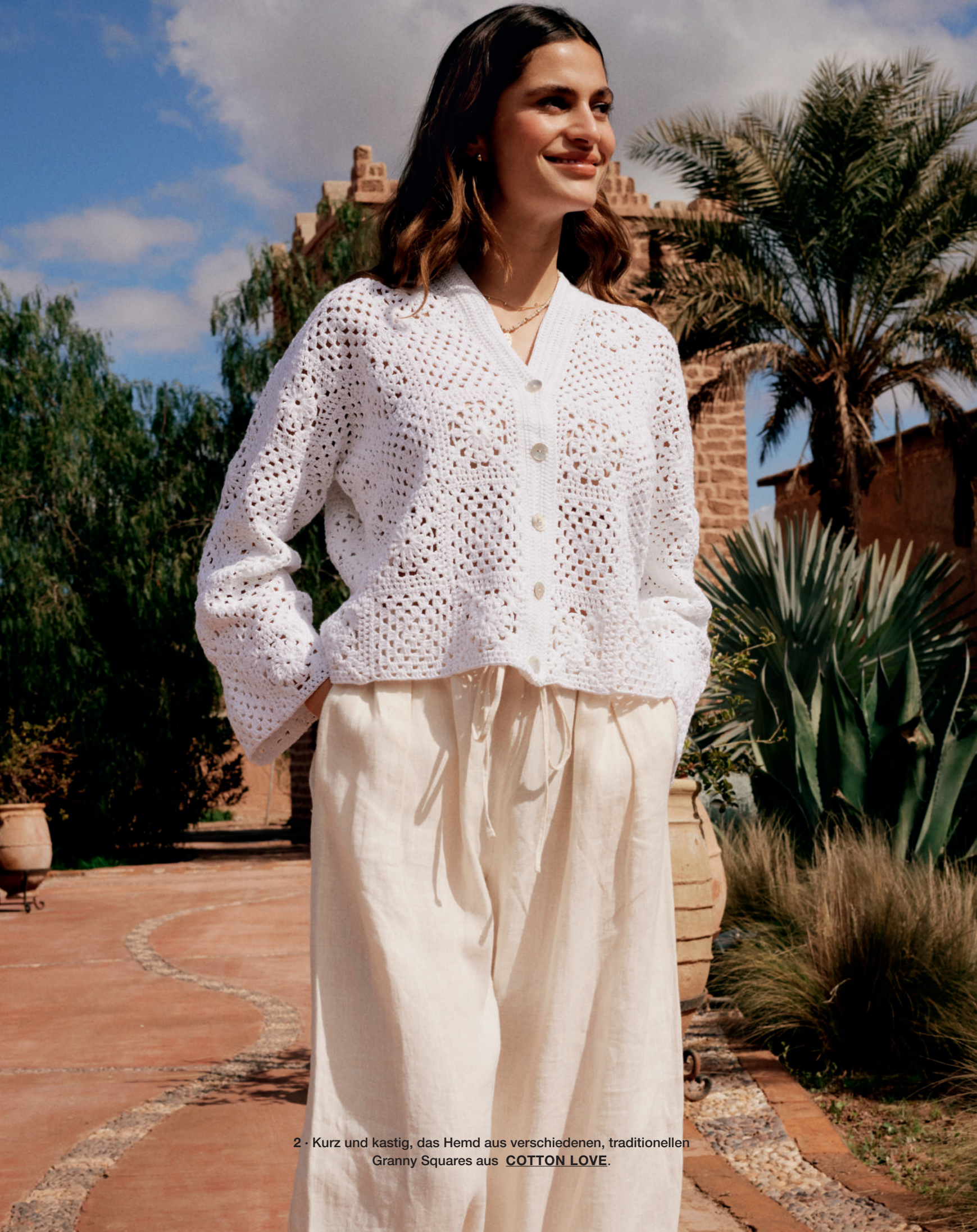
2 · Kurz und kastig, das Hemd aus verschiedenen, traditionellen Granny Squares aus COTTON LOVE .