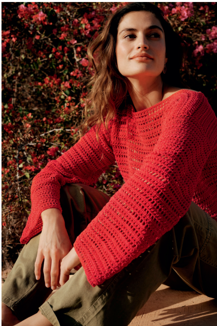
30 · Pullover mit U-Boot-Ausschnitt und geraden Ärmeln aus CAPRI .