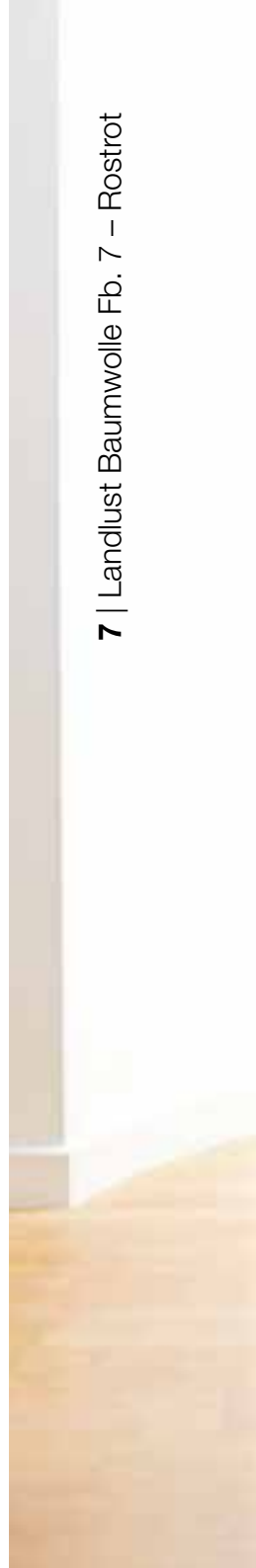
7 | Landlust Baumwolle Fb. 7 – Rostrot