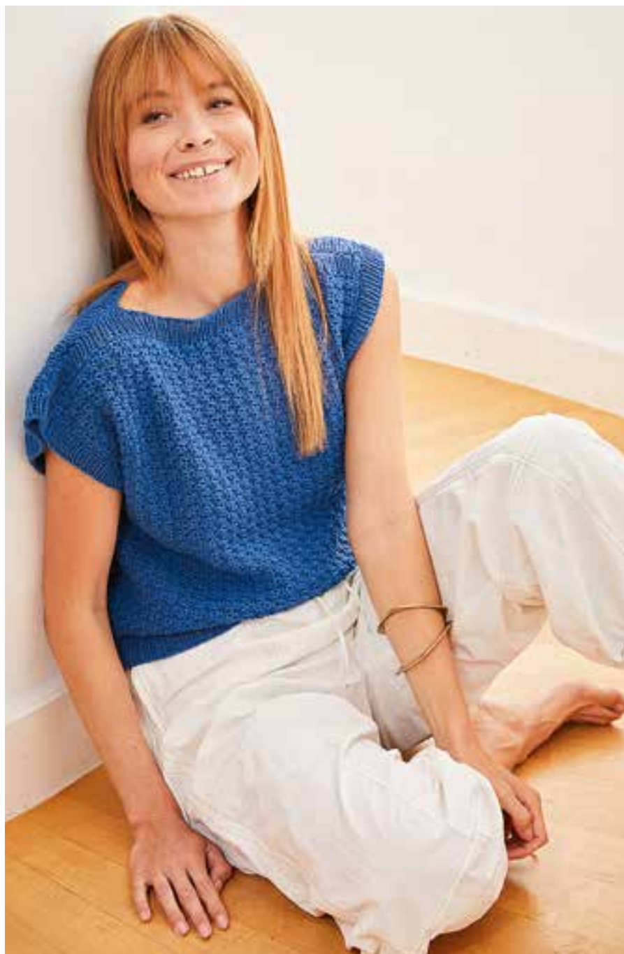
9 | Landlust Baumwolle Fb. 12 – Blau