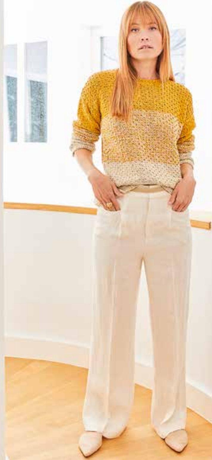
5 | Landlust Sommerseide Fb. 2 – Natur & Fb. 18 – Goldgelb