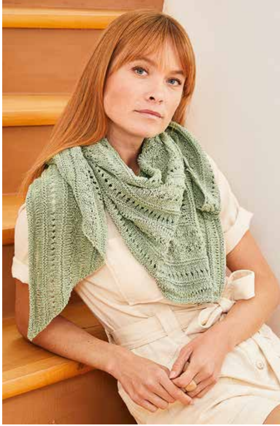
8 | Landlust Sommerseide Fb. 40 – Lindgrün