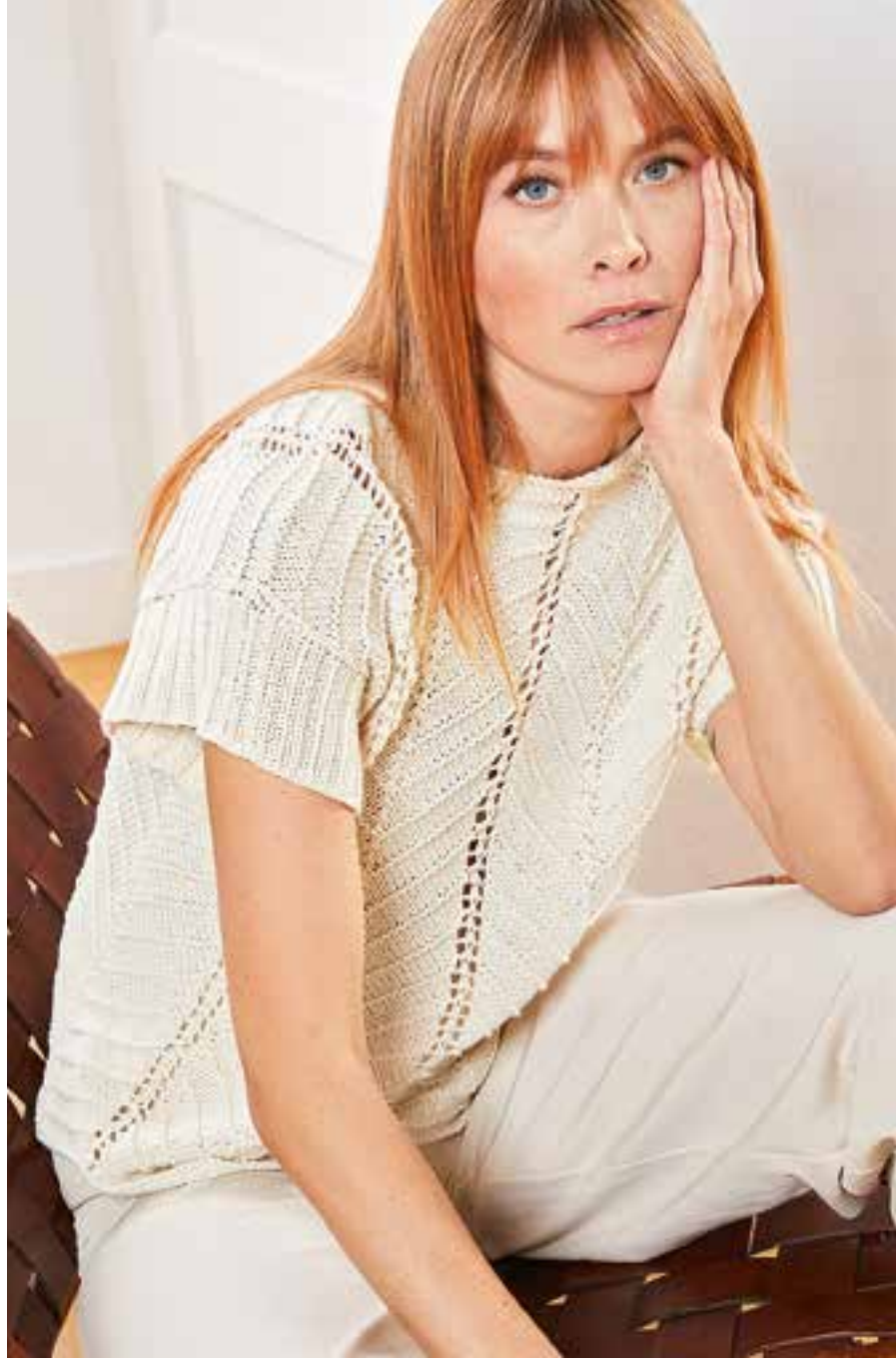
4 | Landlust Baumwolle Fb. 3 – Natur