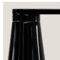
807/J/NE nero / black