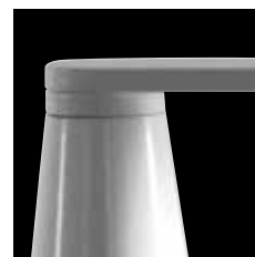
807/BI - 807/J/BI bianco / white