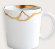
Mug 20 cl / 7 oz 1095/22575