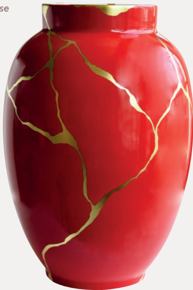
Potiche / Large vase 57 cm / 22.4"