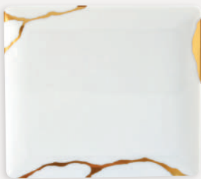
Plateau 17 x 15 cm Rectangular tray 6.7" x 5.9" 1095/8231