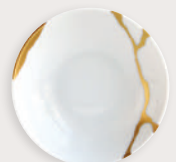
Couppelle Dish 10 cm / 4" 1095/1304