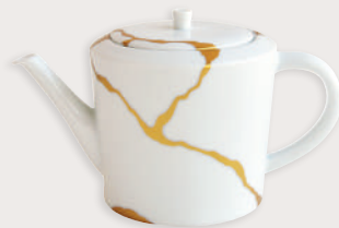
Théière 2 tasses Tea pot 2 cups 1095/22243