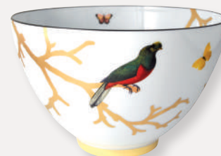
Saladier haut Deep salad bowl 4,2 L D. 27 cm H. 17 cm / 140 oz D. 10.5" H. 6.7" 2488/7635