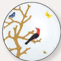
Assiette coupe Bread and butter plate D. 16 cm / D. 6.5" 2488/2553