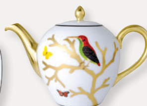
Théière Boule Tea pot Boule 75 cl / 25.5 oz 2488/3088