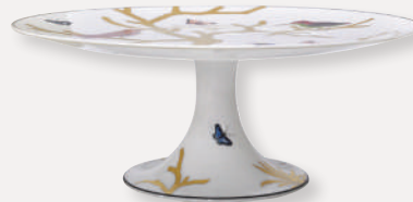
Plateau sur pied Footed cake platter

D. 31 cm H. 12,5 cm / D. 12.2" H. 4.9" 2488/21430