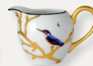
Crémier Boule Creamer Boule 20 cl / 7 oz 2488/3094