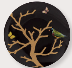
Coffret de 4 assiettes coupes ébène • Set of 4 coupe salad plates