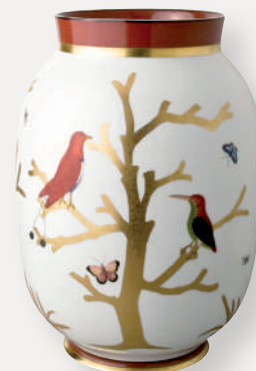
Vase Toscan 1 bis

D. 12,5 cm H. 5,5 cm D. 4.9" H. 2.2" 2488/23117