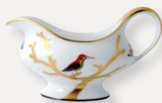
Saucière • Gravy boat 25 cl / 8.5 oz 2488/133