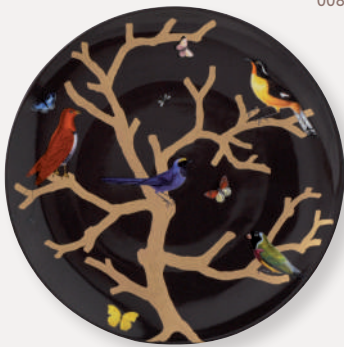
Coupe ébène • Large coupe

H. 15 cm D. 15 cm / H. 5.9" D. 5.9" 2488/21982