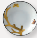
Coupelle Small dish