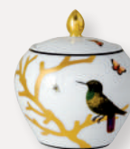
Sucrier Boule Sugar bowl Boule 30 cl / 10 oz 2488/3091