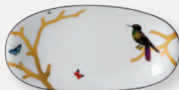
Ravier • Relish dish D. 23 x 12 cm / D. 9" x 5" 2488/125