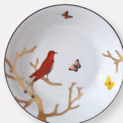
Comptier creux Open vegetable dish 80 cl D. 24 cm / 24 oz D. 9.5" 2488/53