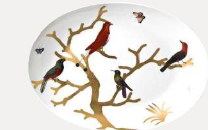
Plat ovale creux / Deep oval platter