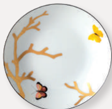
Assiette creuse calotte Coupe soup D. 19 cm / D. 7.5" 2488/26