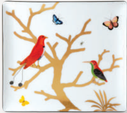
Plateau • Rectangular tray

D. 22 x 19,5 cm / D. 8.5" x 7.5" 2488/8230