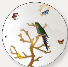
Perruche vert 1770/21259 Assiette coupe • Coupe dinner plate D. 27 cm / D. 10.6"