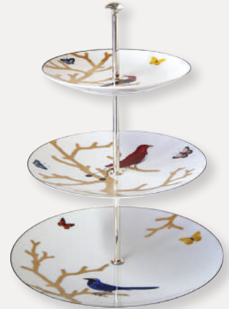
Serviteur 3 niveaux • 3 tiers stand

D. 31 cm H. 12,5 cm / D. 12.2" H. 4.9" 2488/21430