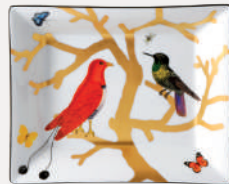
Vide-poches Rectangular ashtray

D. 22 x 19,5 cm / D. 8.5" x 7.5" 2488/8230