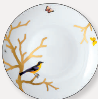
Plat rond creux • Deep round dish D. 29 cm / D. 11.5" 2488/115