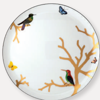
Plat à tarte Round tart platter D. 32 cm / D. 13" 2488/121