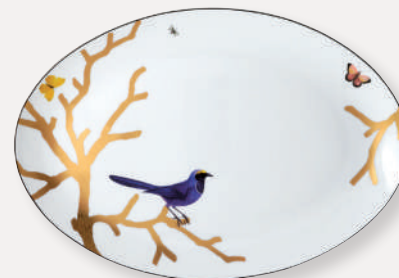
Plat ovale • Oval platter D. 38 cm / D. 15" 2488/107