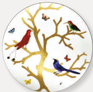
Assiette ultra plate Ultra flat plate D. 31 cm / D. 12.2" 2488/21429