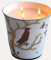
Grand pot à bougie Large candle tumbler

H. 15 cm D. 15 cm / H. 5.9" D. 5.9" 2488/21982