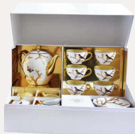
Coffret service à thé Tea gift case 2488/22626