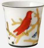
Pot + bougie parfumée 200g Tumbler + candle home fragrance 200g

D. 27 cm H. 36 cm / D. 10.6" H. 14" 2488/21533