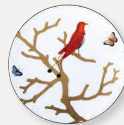
Assiette coupe Coupe salad plate D. 21 cm / D. 8.5" 2488/2551