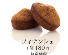
フィナンシェ 1個 180円 蜂蜜使用 1才未満の乳児には与えないでください。