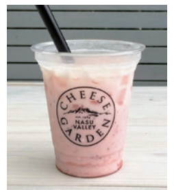
栃木県産いちご使用 いちごヨーグルト 580円

ドリップコーヒー HOT / ICE 380円 紅茶 HOT / ICE 380円 りんごジュース 400円