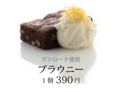
ヴァローナ使用 ブラウニー 1個 390円