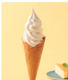
ベイクドチーズケーキ風味のソフト チーズケーキソフト (コーン・カップ) 500円