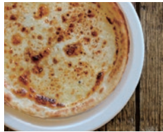
溶け合った4種のチーズ クワトロフォルマッジ 890円 (蜂蜜トッピング プラス50円)