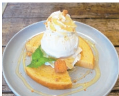
ハニーチーズバウム 780円 蜂蜜使用 1才未満の乳児には与えないでください。