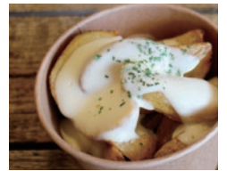
ほくほくポテトにチーズソース ポテトフライ 500円