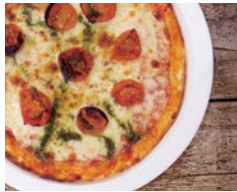
モッツアレラとトマト マルゲリータ 890円