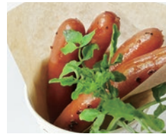
パリッと食感と豚肉の旨味 ウイナー 4本 500円