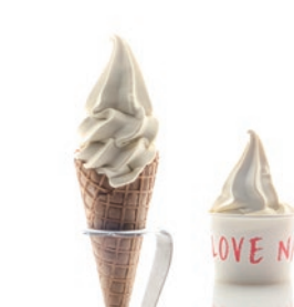
ソフトクリーム (コーン・カップ) バニラ味 380円