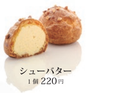
シューバター 1個 220円