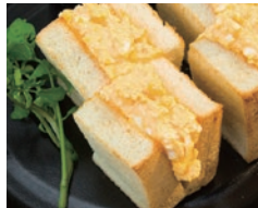
那須御養卵使用 特製卵サンド 680円