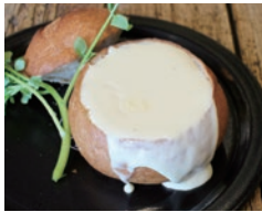
とナーチーズとふんわりパン チーズパンデュー 800円