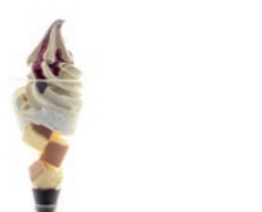
御用邸チーズケーキ、ホイップクリーム、 チーズケーキ味のソフトクリームを重ね、 ベリーのソースをかけました 御用邸パフェ 680円