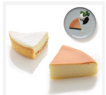
チーズガーデン1番人気のベイクドタイプのチーズケーキ 御用邸チーズケーキ (1/6 カット) イトイン 510円 テイクアウト 460円