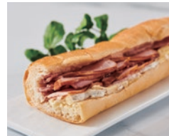
ブリーチーズとモモベーコン フェリージェ 450円