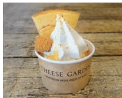
ハニーチーズバウムソフト 550円 蜂蜜使用 1才未満の乳児には与えないでください。