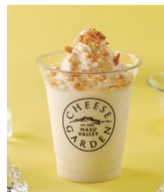
レアチーズケーキ風味の「飲むチーズケーキ」 チーズドリンク 680円