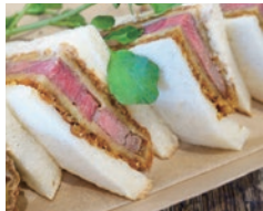
柔らかなお肉とさくさく歯応え 牛カツサンド 1,480円