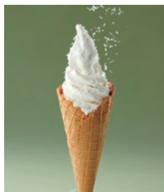
グラナパダーノを削ってチーズ感アップ ダブルチーズケーキソフト (コーン・カップ) 550円