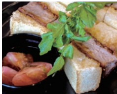
揚げたてカツと自家製ソース あつあつソースカツサンド 1,280円