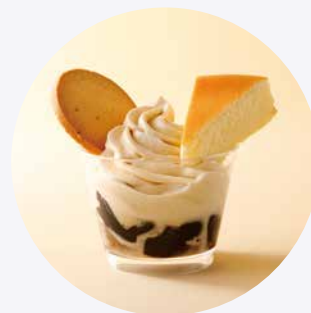
チーズケーキソフトに 御用邸チーズケーキ・クッキーをトッピング 御用邸チーズケーキサンデー 700円