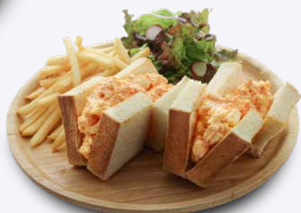
御養卵タマゴサンド 1,050円 ドリンク付き 1,350円