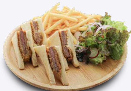
ビーフカツサンド 1,580円 ドリンク付き 1,880円