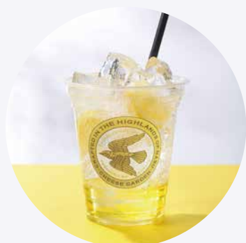
レモン果汁と自家製シロップをきかせた爽やか炭酸 自家製シロップのレモンスカッシュ 550円