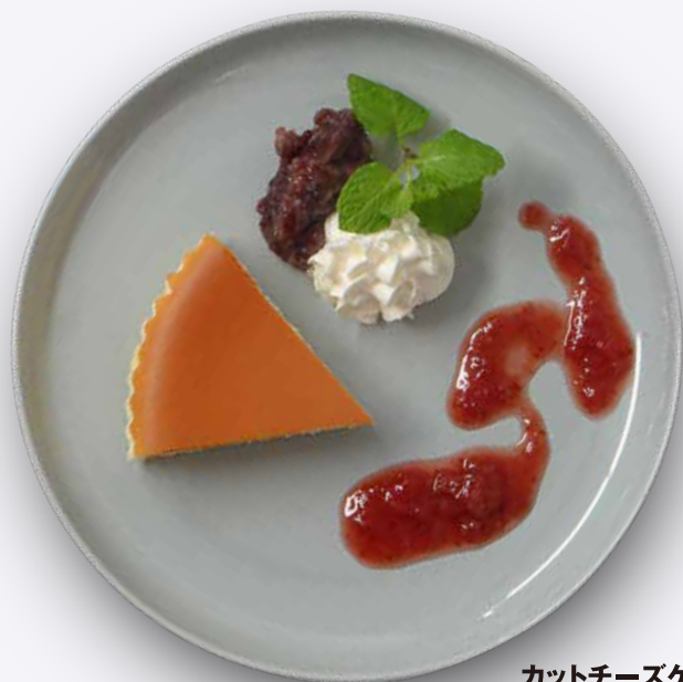
カットチーズケーキ 御用邸チーズケーキ 500円 ドリンク付き 800円 NASU WHITE フロマージュブラン 650円 ドリンク付き 950円