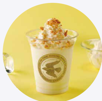
チーズ風味の「飲むレアチーズケーキ」フラッペ フロマージュドリンク 750円