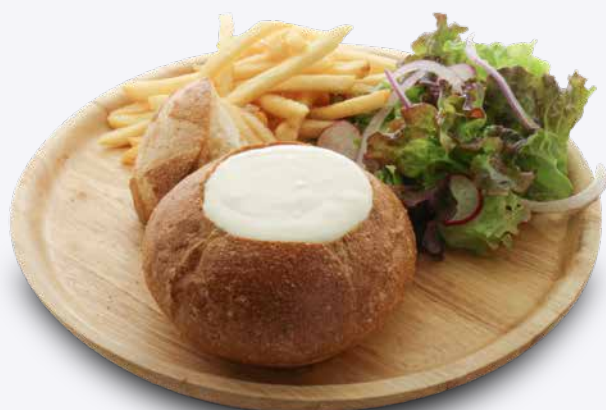
オリジナルチーズパンデュー 1,100円 ドリンク付き 1,400円