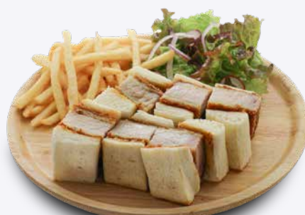
肉厚ロースカツサンド 1,650円 ドリンク付き 1,950円