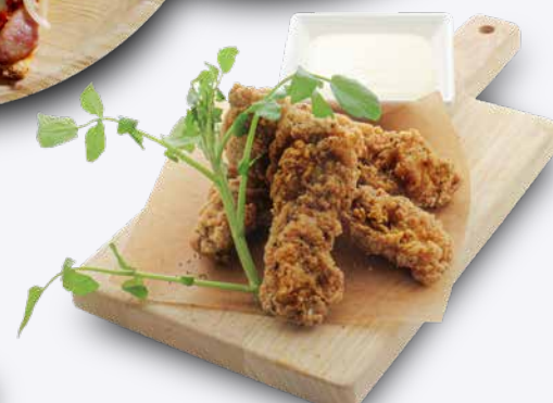
フライドチキン 890円 ドリンク付き 1,190円