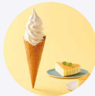
バイクドチーズケーキ風味の 濃厚ソフトクリーム チーズケーキソフト コーン/カップ 550円