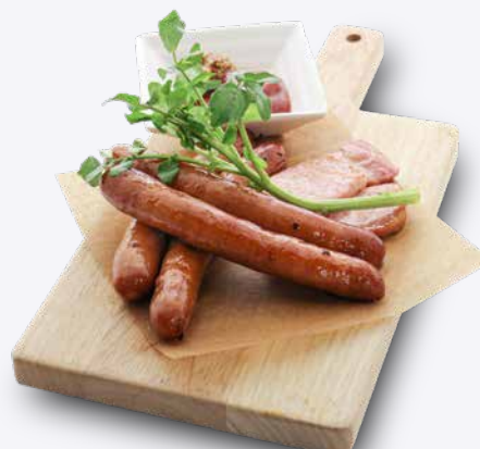
あらびきウインナー& ベーコン 890円 ドリンク付き 1,190円