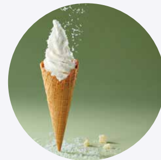
グラナパダーノを削って チーズ感アップ ダブルチーズケーキソフト コーン/カップ 600円