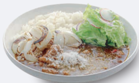
チーズオニオンカレー 1,200円 ドリンク付き 1,500円