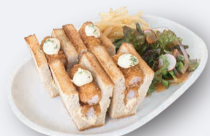
海老カツサンド 1,200円 ドリンク付き 1,500円