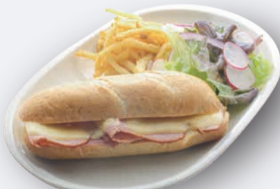
ハム&チーズドッグ 1,100円 ドリンク付き 1,400円