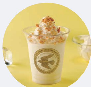
チーズ風味の「飲むレアチーズケーキ」フラッペ フロマージュドリンク 750円