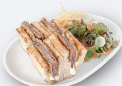
牛カツチーズサンド 1,300円 ドリンク付き 1,600円