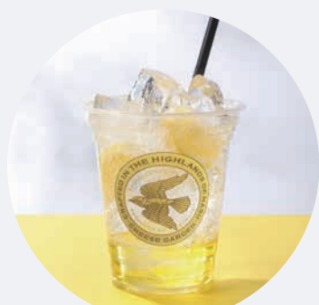
レモン果汁と自家製シロップをきかせた爽やか炭酸 自家製シロップのレモンスカッシュ 550円