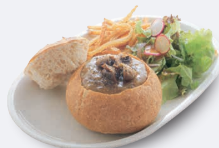
チーズパンデュ キノコのソース 1,250円 ドリンク付き 1,550円