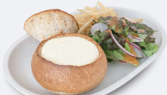
オリジナルチーズパンデュ 1,100円 ドリンク付き 1,400円