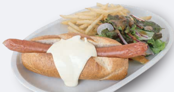
オリジナルチーズドッグ 1,100円 ドリンク付き 1,400円