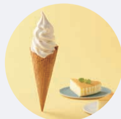
バイクチーズケーキ風味の濃厚ソフトクリーム チーズケーキソフト コーン/カップ 550円