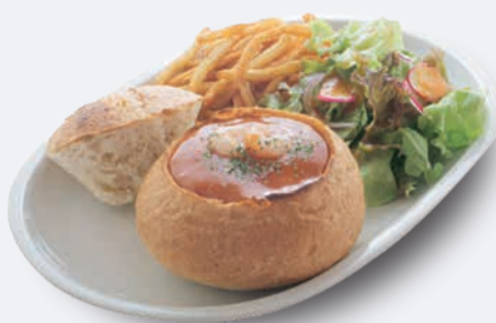
チーズパンデュ エビのビスコソース 1,250円 ドリンク付き 1,550円