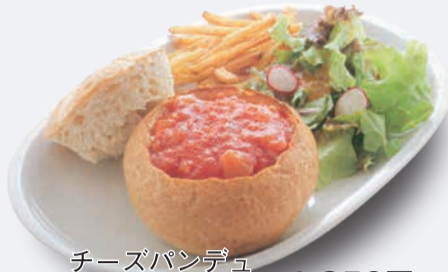
チーズパンデュ HOTアメリカンチリソース 1,250円 ドリンク付き 1,550円