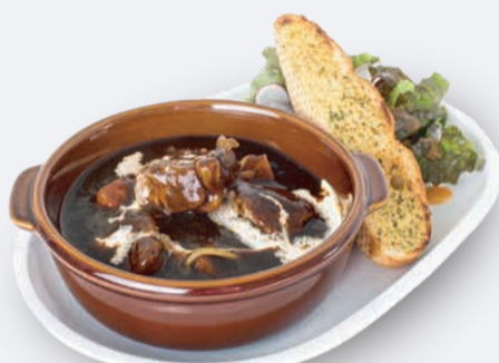
ビーフンチュ プレート 1,500円 ドリンク付き 1,800円