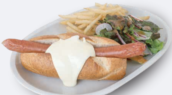
オリジナルチーズドッグ 1,100円 ドリンク付き 1,400円