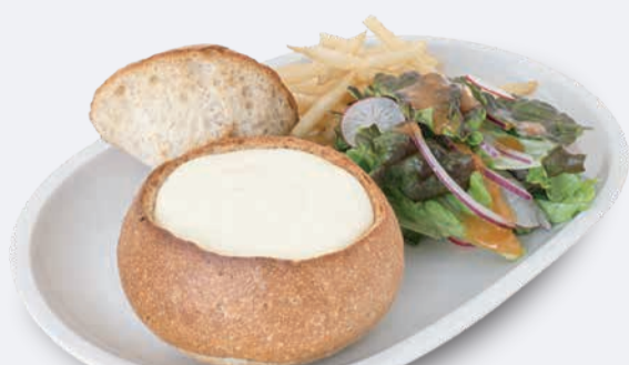
オリジナルチーズパンデュ 1,100円 ドリンク付き 1,400円