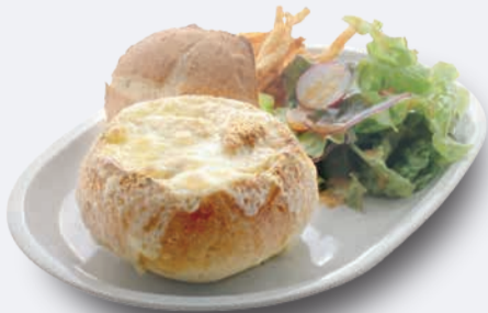
グリルドパンデュ 1,200円 ドリンク付き 1,500円