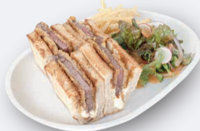
牛カツチーズサンド 1,300円 ドリンク付き 1,600円