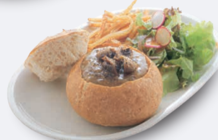
チーズパンデュ キノコのソース 1,250円 ドリンク付き 1,550円