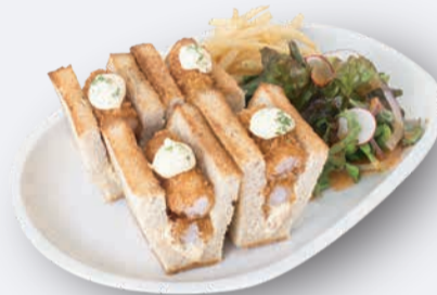
海老カツサンド 1,200円 ドリンク付き 1,500円