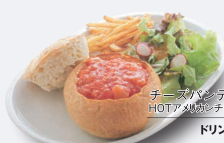
チーズパンデュ HOTアメリカンチリソース 1,250円 ドリンク付き 1,550円