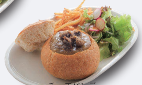
チーズパンデュ キノコのソース 1,250円 ドリンク付き 1,550円