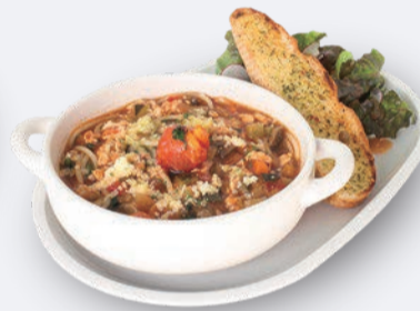
トマトパスタ プレート 1,400円 ドリンク付き 1,700円