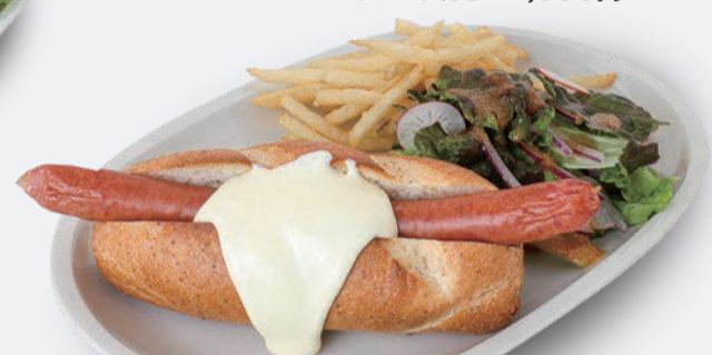
オリジナルチーズドッグ 1,100円 ドリンク付き 1,400円