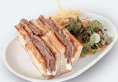
牛カツチーズサンド 1,300円 ドリンク付き 1,600円