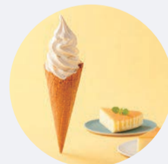
ベイクドチーズケーキ風味の濃厚ソフトクリーム チーズケーキソフト コーン/カップ 550円