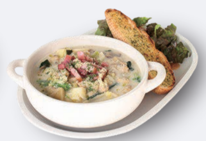
シーフードクリームパスタ プレート 1,400円 ドリンク付き 1,700円