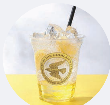
レモン果汁と自家製シロップをきかせた爽やか炭酸 自家製シロップのレモンスカッシュ 550円