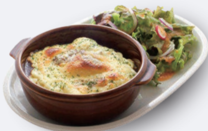
焼きチーズカレー 1,400円 ドリンク付き 1,700円