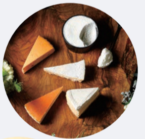
チーズケーキアソート 1,600円 ドリンク付き 1,900円