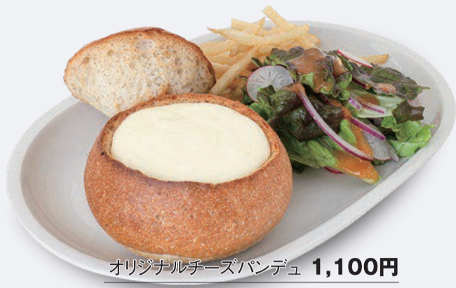
オリジナルチーズパンデュ 1,100円 ドリンク付き 1,400円