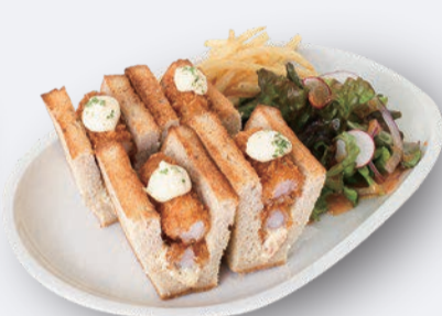
海老カツサンド 1,200円 ドリンク付き 1,500円