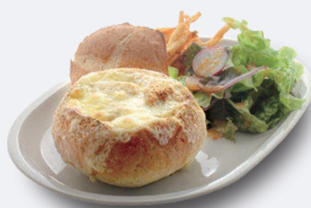
グリルドパンデュ 1,200円 ドリンク付き 1,500円