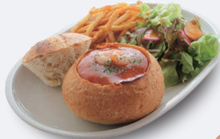
チーズパンデュ エビのピスクソース 1,250円 ドリンク付き 1,550円