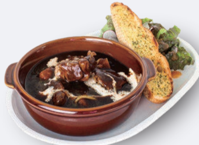
ビーフシチュー プレート 1,500円 ドリンク付き 1,800円