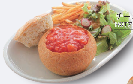
チーズパンデュ HOTアメリカンチリソース 1,250円 ドリンク付き 1,550円