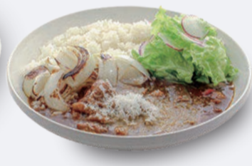
チーズオニオンカレー 1,200円 ドリンク付き 1,500円