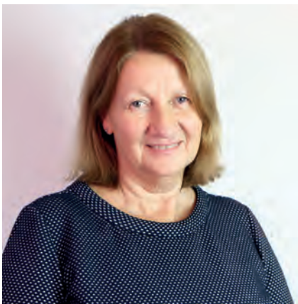
AURA-SOMA® registered Practitioner & Teacher

Am 14. Januar 2019 ist die neue Equilibrium Flasche 116 | Königsblau/ Magenta entstanden. Ihre farbliche Erscheinung wirkt träumerisch, mystisch, fast wie der Welt entrückt. Sie repräsentiert das Zusammenwirken des 6. und 8. Chakras, mit deren Farben diese Kombination übereinstimmt. Dadurch wendet sich die neue Equilibrium Flasche an ein grundsätzliches Thema des menschlichen Daseins – die Kraft unserer Visionen und ihre Verwirklichung.