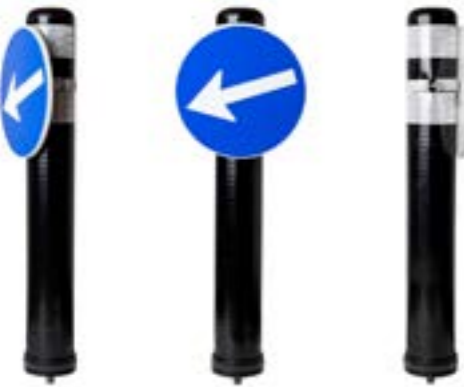
203830.2 optional mit Schilderhalter