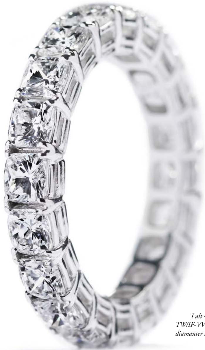
I alt 4,08 ct. TW/IF-VVS cushion-cut diamanter kr. 143.000,-