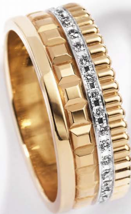
Quatre Radiant edition, i alt 0,26 ct. kr. 44.800,-