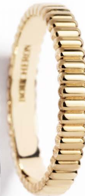
Quatre Grosgrain kr. 8.800,-