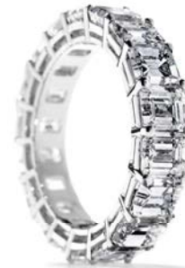
I alt 8,02 ct. River-TW/VVS-VS smaragdslebne diamanter kr. 319.500,-