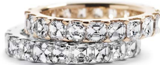
I alt 3,96 ct. River-TW/IF-VS Asscher-cut diamanter kr. 108.500,-