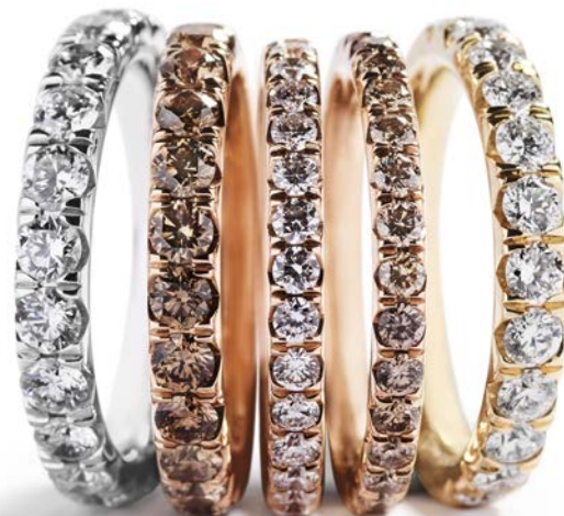
Fra kr. 9.900,-

Mix og match forskellige allianceringe og få dit personlige udtryk. Når flere forskellige allianceringe sættes sammen, understreger det hver enkelt ring, der får sine karakteristika fremhævet. Når ringe med farvede diamanter sættes sammen med allianceringe med hvide diamanter, fremstår farverne endnu tydeligere. På samme måde fremstår smalle allianceringe tydeligere, når de sættes sammen med bredere ringe eller ringe, hvor diamanterne er Fancy Cut slebet. Når der mixes og matches, sættes flere historier sammen og understreger det personlige.