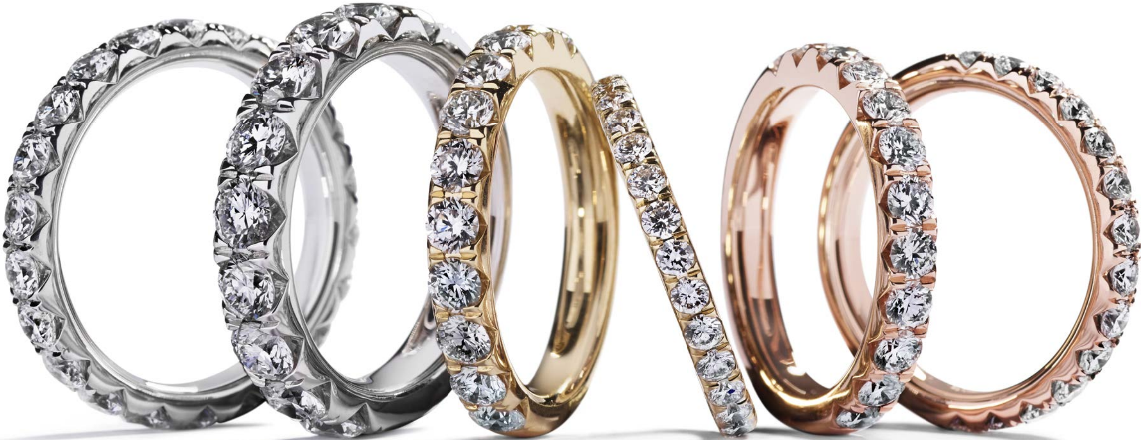
I alt 2,10 ct. TW/VVS-VS kr. 50.800,-