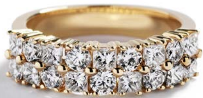
I alt 1,66 ct. TW-W/VVS-VS diamanter kr. 32.500,-