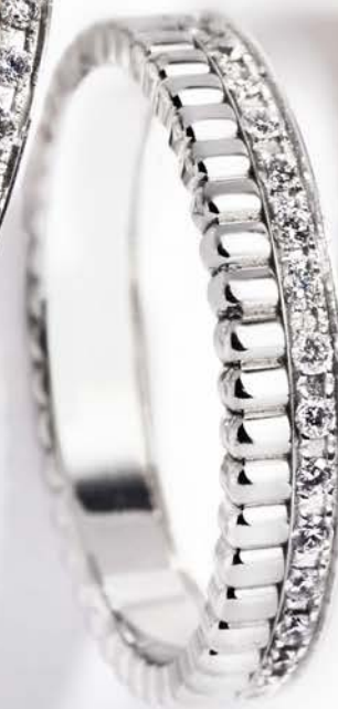
Quatre Radiant edition, i alt 0,27 ct. kr. 31.500,-