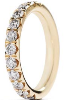
I alt 0,54 ct. Argyle Blå diamanter kr. 129.000,-