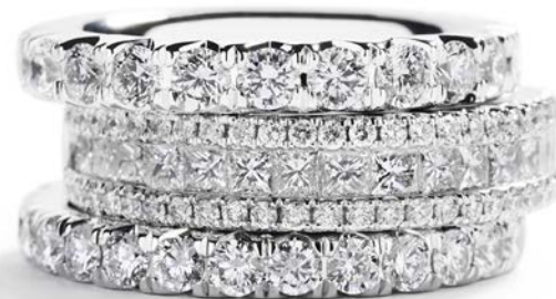
Fra oven og ned Kr. 23.900,- Kr. 19.500,- Kr. 33.900,-