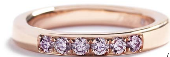
I alt 0,43 ct. Fancy Intense Pink/VVS-VS kr. 58.500,-

Nu er tiden inde til at lege og kreere spændende farvede allianceringe fra Argyle-minen, som ikke er set før, og som ikke kan genfremstilles.