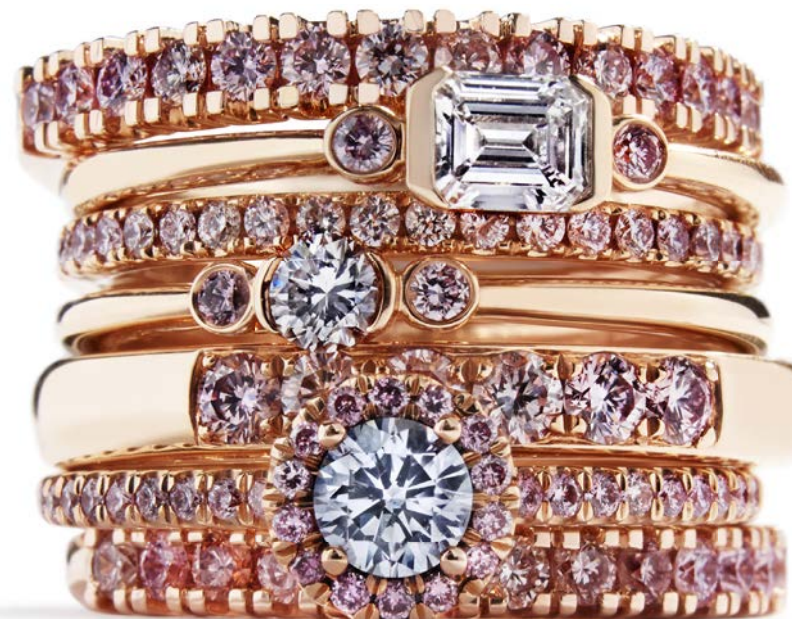
Argyle Pink ringe fra kr. 18.500,-