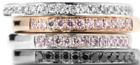
Fra kr. 8.000,-