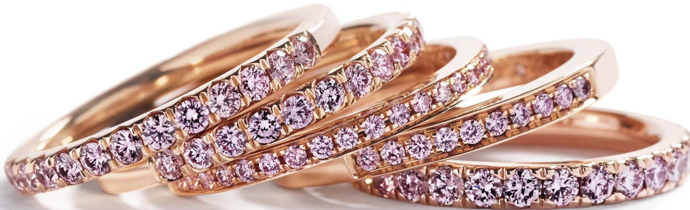
Argyle Pink fra venstre til højre: I alt 0,38 ct. Fancy Intense Pink diamanter kr. 79.500,- I alt 0,32 ct. Fancy Intense Pink diamanter kr. 69.500,- I alt 0,32 ct. Fancy Intense Pink diamanter kr. 48.000,- I alt 0,12 ct. Fancy Intense Pink diamanter kr. 23.900,- I alt 0,30 ct. Fancy Intense Pink diamanter kr. 49.500,-