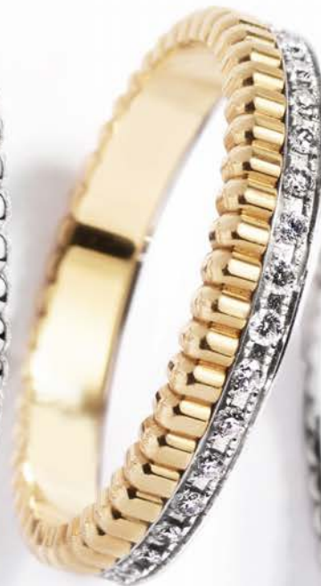
Quatre Radiant edition, i alt 0,27 ct. kr. 30.000,-