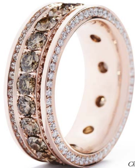
Champagnefarvede/VS diamanter samt i alt 1,30 ct. TW/VVS-VS brillanter kr. 52.500,-