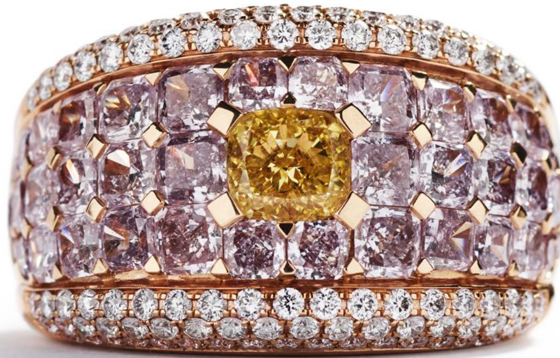
0,78 ct. Fancy Vivid Yellow cushion-cut diamant samt i alt 3,48 ct. Argyle Pink diamanter