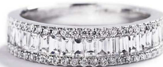
I alt 1,16 ct. TW/VVS-VS diamanter kr. 19.500,-