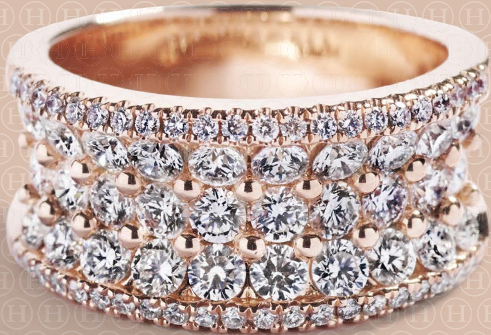
I alt 1,96 ct. TW/VVS-VS diamanter kr. 39.500,-