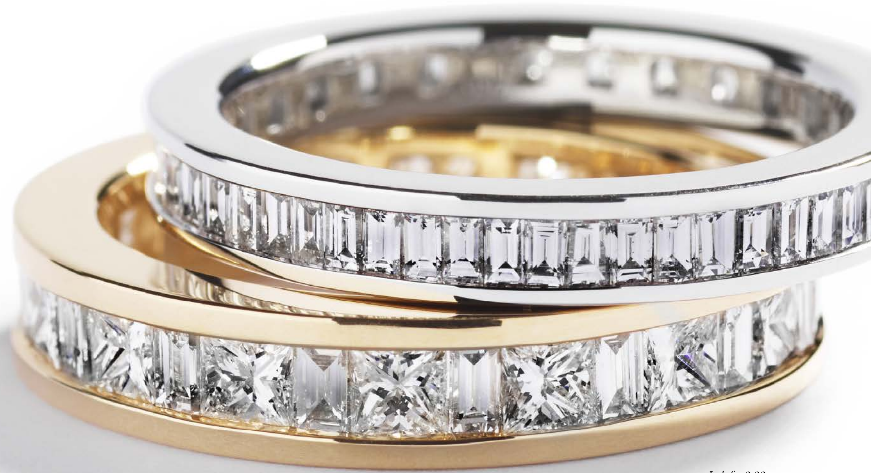
I alt fra 2,22 ct. TW-W/VVS-VS diamanter fra kr. 45.000,-