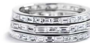
I alt fra 0,93 ct. TW/VVS-VS baguetteslebne diamanter fra kr. 19.000,-