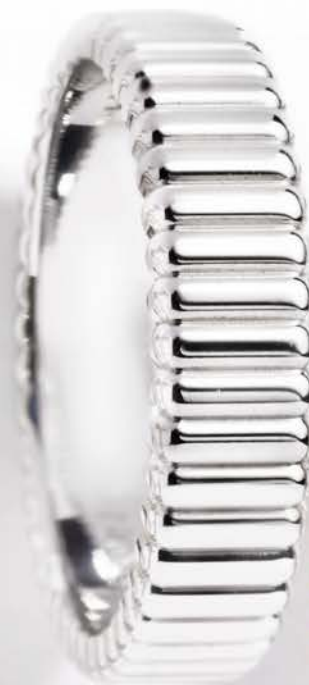
Quatre Grosgrain kr. 13.000,-