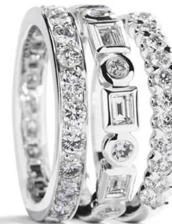
Fra venstre mod højre Kr. 28.500,- Kr. 16.250,- Kr. 8.900,-