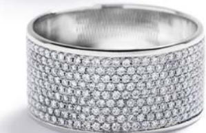
Øverst til nederst: I alt 4,11 ct. TW/VVS-VS diamanter kr. 69.500,- I alt 4,23 ct. TW/VVS-VS diamanter kr. 83.900,- I alt 1,96 ct. TW/VVS-VS diamanter kr. 39.500,- I alt 0,69 ct. TW/VVS-VS brillanter kr. 29.500,-