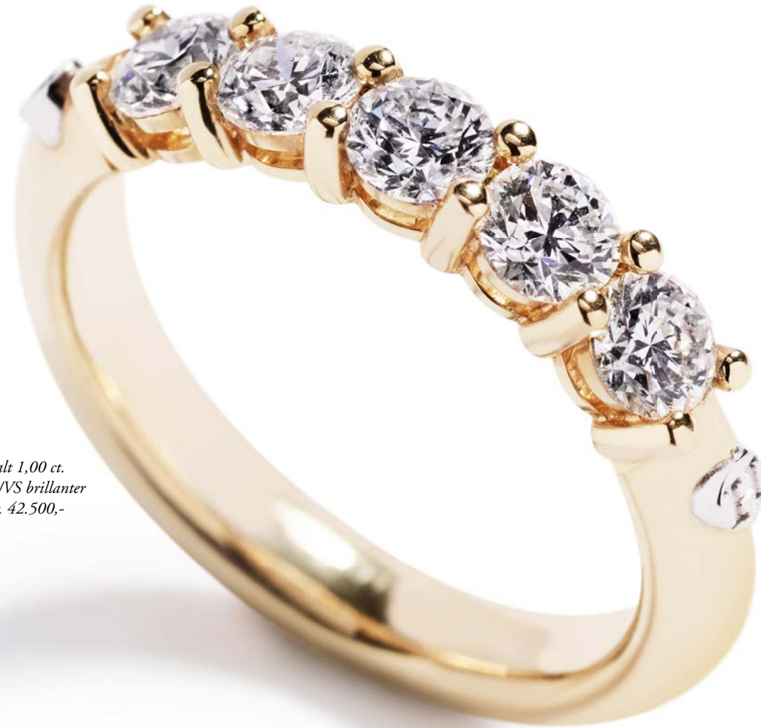
I alt 1,00 ct. River/VS brillanter kr. 42.500,-