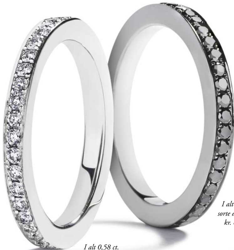
I alt 0,58 ct. TW/VVS-VS kr. 18.000,-