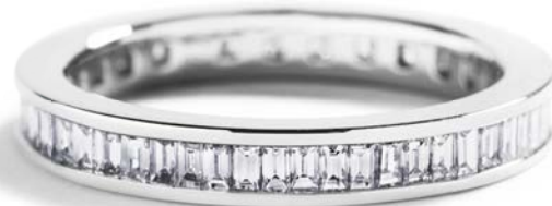
I alt 0,94 ct. TW/VVS-VS baguetteslebne diamanter kr. 14.900,-