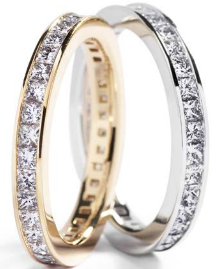
I alt 1,40 ct. TW/VVS-VS diamanter kr. 14.900,-