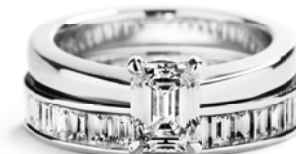
Alliancering i alt 3,20 ct. TW/VVS-VS smaragdslebne diamanter kr. 63.000,-