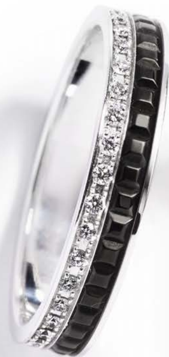
Quatre Black edition, i alt 0,27 ct. kr. 29.500,-