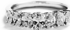
I alt 1,37 ct. TW/VS ovale diamanter kr. 39.500,-