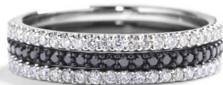
Fra kr. 5.900,-