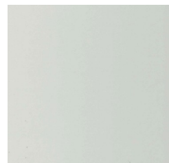
Melamina 16mm Gris Claro