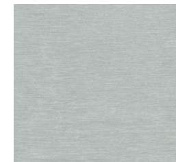
Melamina 25mm Aluminizado