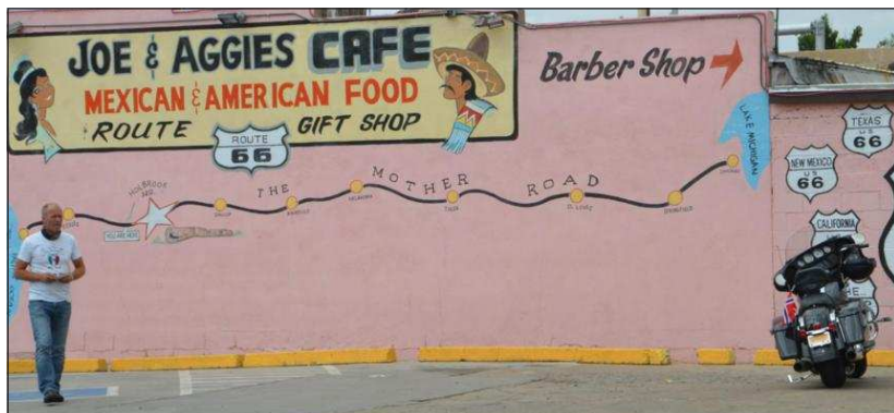
MATBIT: På Joe & Aggies var det tid for en liten matbit.

I de beige ørkenlandskapene i Nevada smelter sola nesten både krom og gummi. Støvet blander seg med svette og solkrem. Fra bakerovnen i Neva-