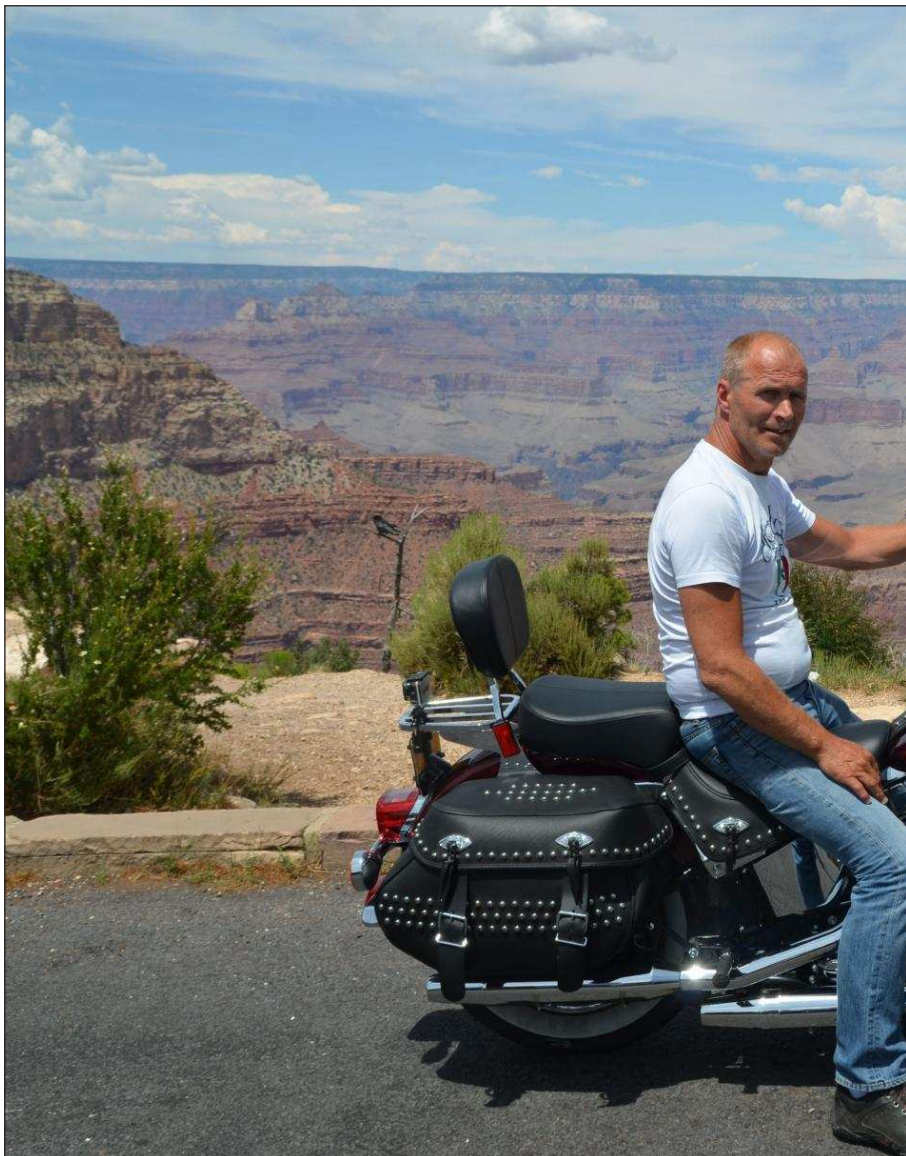
CANYON: Et mektig syn for de fleste som tar turen langs Route 66 er Granc Canyon.