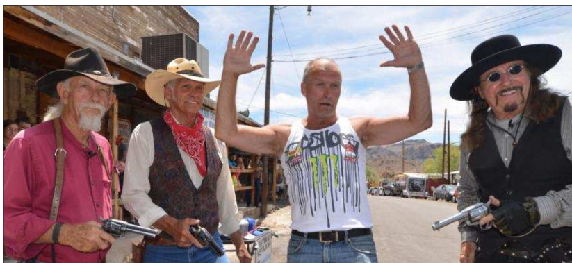
OATMAN: I den gamle gullgraverbyen Oatman kunne man møte p litt av hvert.