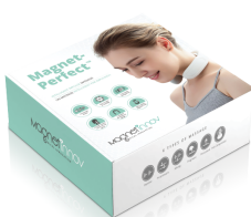
Magnet-Perfect™ The Therapeutic Neck Massager