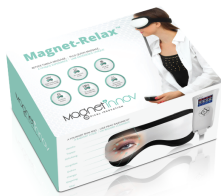
Magnet-Innov© The Eye Massager