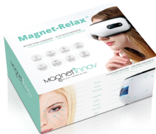
Magnet-Relax 2.0 Smart Eye Massager