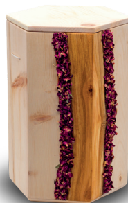
„ELEGANZ“ Ast längs eingearbeitet