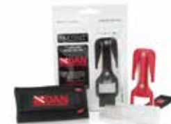
EEZYCUT ™ CORTADOR DE LÍNEA 641-2500