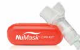
BOQUILLA DE BOLSILLO 611-9105