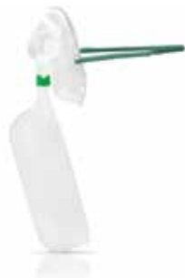
611-8100 Máscara anti-retorno

La máscara anti-retorno proporciona un flujo constante de oxígeno para los buzos que respiran y se puede usar en situaciones en las que dos buzos necesitan oxígeno simultáneamente. La máscara de reanimación oronasal de DAN está equipada con una entrada de oxígeno para ventilaciones de boca a máscara y proporciona oxígeno adicional a los buzos lesionados que no respiran. Esta máscara se puede usar con una válvula de demanda o MTV-100.