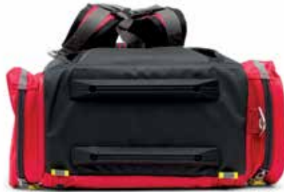
DISEÑO INFERIOR REFORZADO