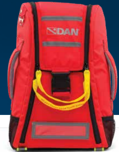
631-2803 Mochila Ligera Trauma Kit

El kit de trauma de DAN le permite brindar una respuesta rápida y efectiva para lesiones que van desde pequeños cortes y rasguños hasta heridas severas, pinchazos y laceraciones. Este kit está provisto de paños, gasas, vendajes, vendajes-hemostáticos y una variedad de componentes de primeros auxilios para detener el sangrado rápidamente. Elija entre una caja impermeable o una mochila ligera para adaptarse mejor a su aplicación.