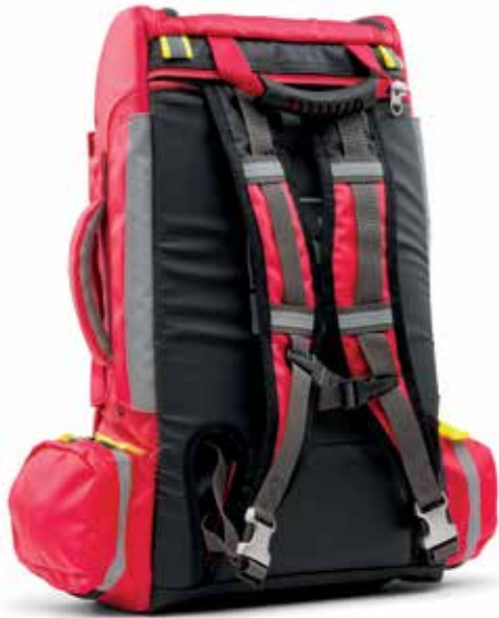
MOCHILA CON CORREAS AJUSTABLES