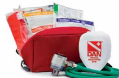
KIT DE PRIMEROS AUXILIOS Y OXÍGENO COMPONENTES INCLUIDOS