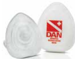
611-8300 Máscara de reanimación Oronasal 611-8305 Válvula unidireccional de repuesto con / filtro