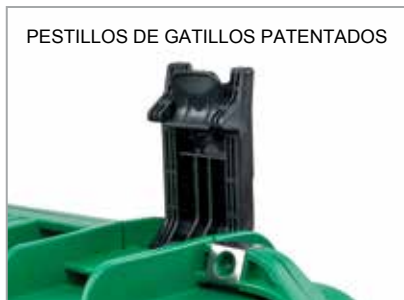
PESTILLOS DE GATILLOS PATENTADOS