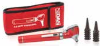
OTOSCOPIO ÓPTICO DE FIBRA CON BOLSA 501-2450