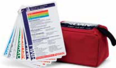
KIT DE PRIMEROS AUXILIOS Y PIZARRAS INCLUIDAS