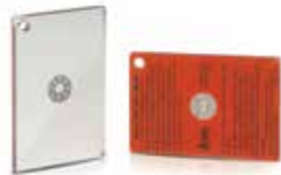
ESPEJO DE SEÑALES 641-1003