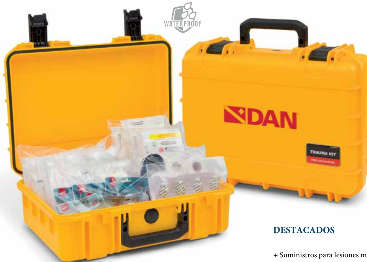
631-2800 Trauma Kit Caja Estanca