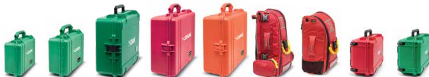
Bote Unidad de Oxigeno Pak de Rescate Pak de Rescate Cuidado Extendido Emergencia Kid de Respuesta O 2 Cardíaco Completo Cuidado Extendido. Mochila Ligera Primeros Auxilios Mochila w/O 2 Pak de Rescate Ext. Plus w/FA Pak de Rescate Extended Plus