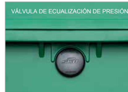
VÁLVULA DE ECUALIZACIÓN DE PRESIÓN