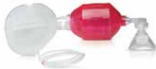
MÁSCARA DE VÁLVULA CON BOLSA INTELIGENTE 611-8700