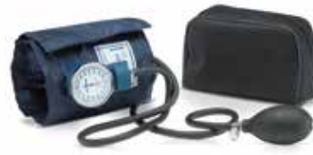
ESFIGMOMANÓMETRO DE PRESIÓN SANGÜNEA 671-2500