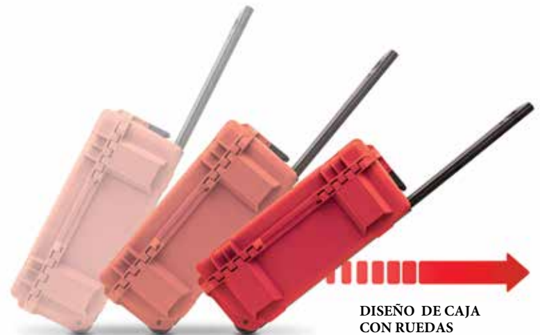
DISEÑO DE CAJA CON RUEDAS