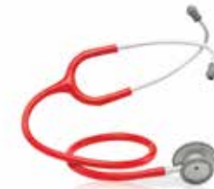
ESTETOSCOPIO PRO 611-8800