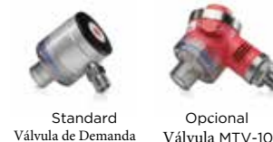
Standard Válvula de Demanda