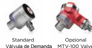
Standard Válvula de Demanda Opcional MTV-100 Valve