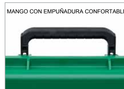
MANGO CON EMPUÑADURA CONFORTABLE