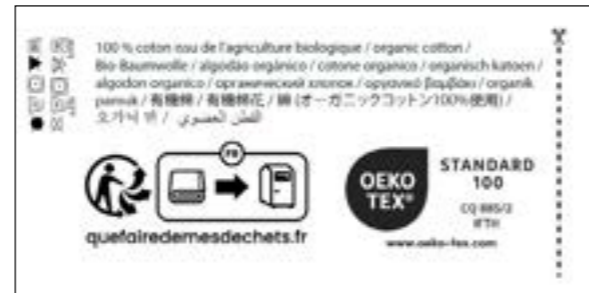
Verso / Back