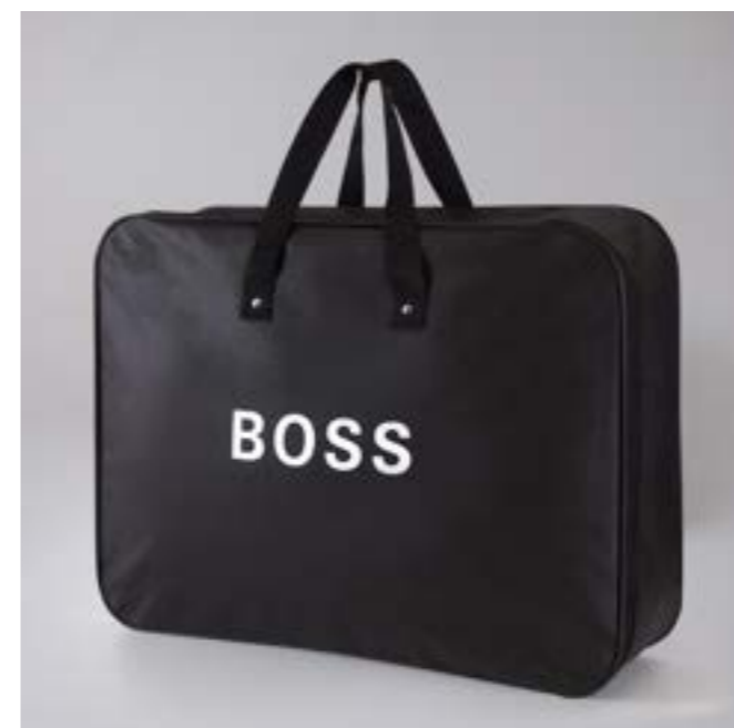
Packaging couettes & oreillers Duvets and pillows packaging

Safety. The manufacturers guarantee irreproachable quality for two years of proper use of the product, respecting care instructions.