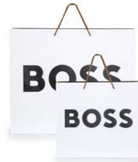
Sacs / Bags

Tailles : Petit (1028478) - Grand (1028479)