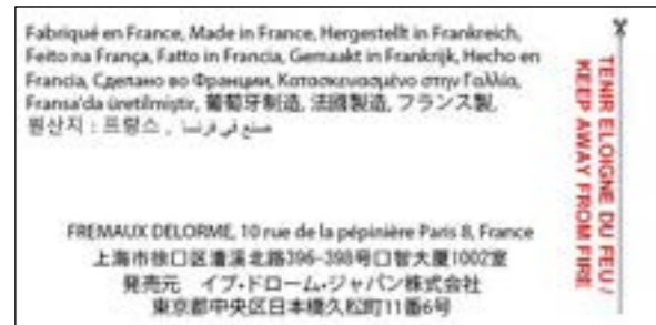
Recto / Front

A new care label is now available on all the items. It will integrate 15 languages. These logos may appear: