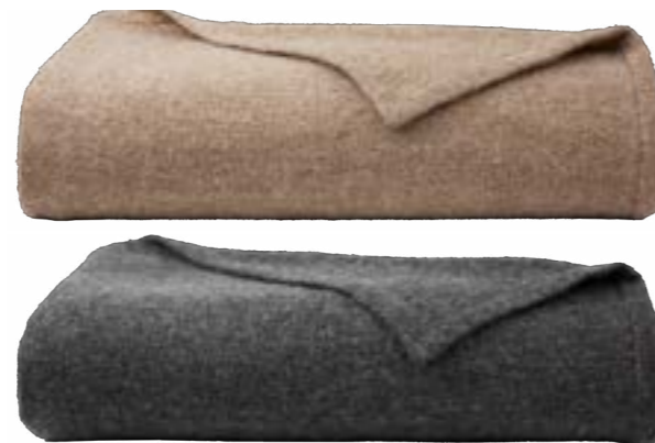
Light Camel - Charcoal