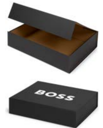
Boîte cadeau / Gift box