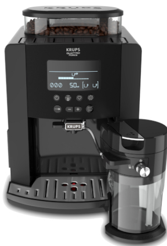
Krups Arabica Latte