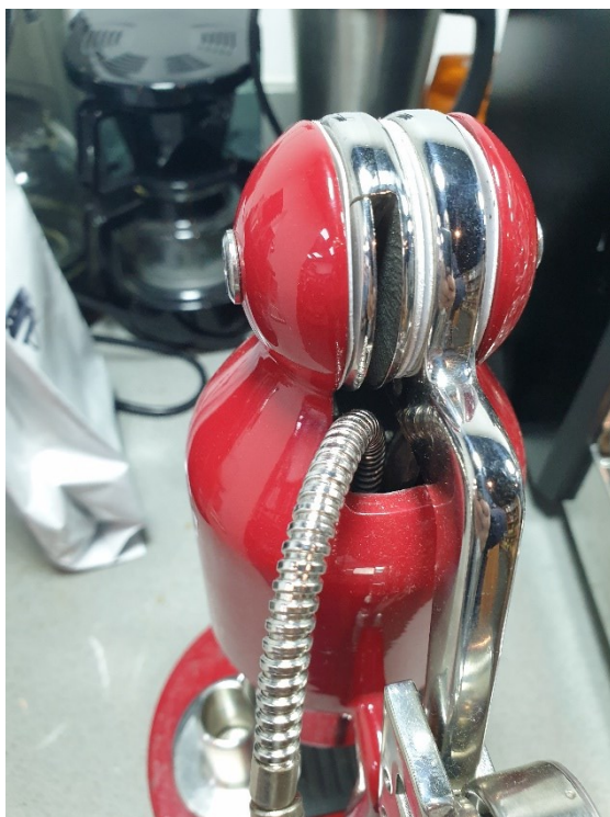
תמונה מספר 2 – שימוש נכון במכונה