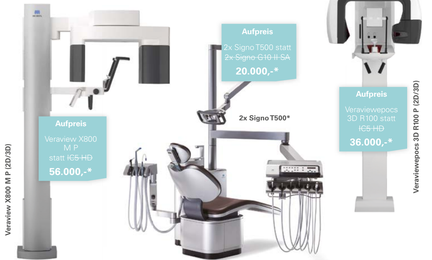
Veraview X800 M P (2D/3D)

Aufpreis Veraview X800 M P statt IC5 HD 56.000,-*