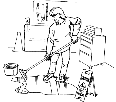
Algunos peligros, como pisos mojados y resbalosos, se pueden eliminar de inmediato.