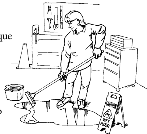
Algunos peligros, como pisos mojados y resbalosos, se pueden eliminar de inmediato.