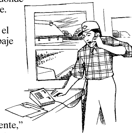
Sepa que información dar a la persona que recibe la llamada de emergencia.