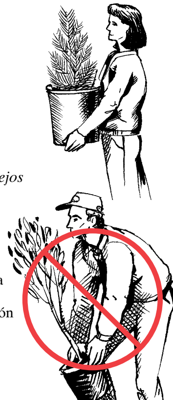
No se incline hacia adelante al bajar objetos.