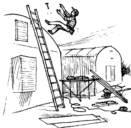
Si tiene mucha prisa para terminar el trabajo puede resultar en un accidente.