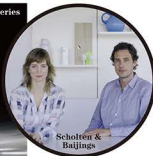
Scholten & Baijings