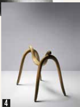
OBJECT 2014 © ALDO BAKKER