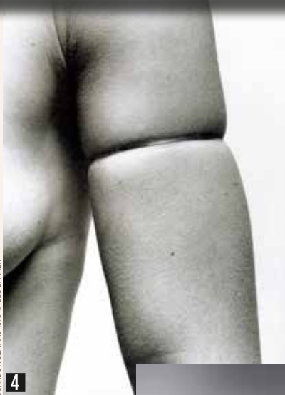
SCHADUWSEERAAD 1973 © GIJS BAKKER