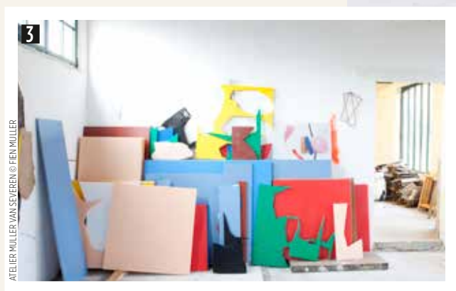
ATELIER MULLER VAN SEVEREN

Le labo des héritiers, 21/9-4/1/2015, di-zo, 10u-18u, Grand-Hornu Images, Site du Grand-Hornu, rue Sainte Louise 82, Hornu. www.grand-hornu-images.be