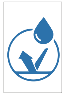
RESISTENTE AL AGUA