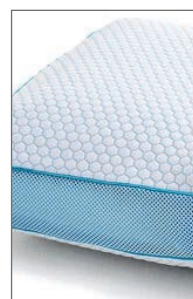
MALLA LATERAL RESPIRABLE