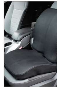
DISEÑO 2 EN 1