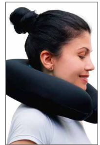
AVANZADA TECNOLOGÍA EN CONFORT