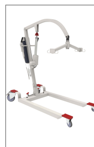
COMPATIBLE CON THERATOMIC