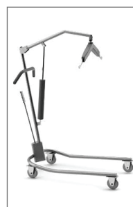
COMPATIBLE CON THERAMOTION

Cuenta con 4 correas de altísima resistencia que mantienen en cómodo equilibrio al usuario mientras es transportado.