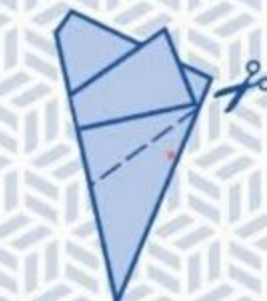
8 Knip af langs de stippellijn