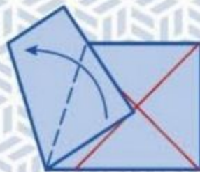
5 Maak een vouw op de stippellijn