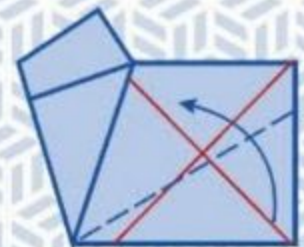
6 Maak een vouw op de stippellijn