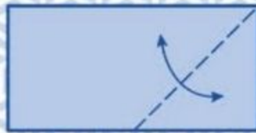
2 Maak een vouw op de stippellijn