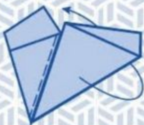
7 Vouw naar achter op de stippellijn