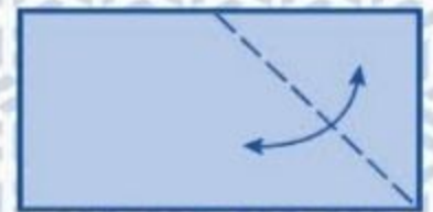
3 Maak een vouw op de stippellijn