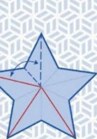
10 Maak een vouw op de stippellijn en vouw naar achter