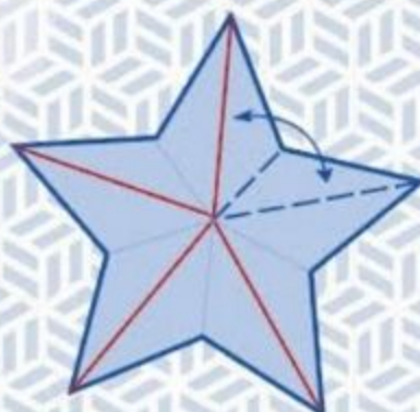
11 Maak een vouw op de stippellijn en vouw naar achter