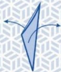
9 Vouw open