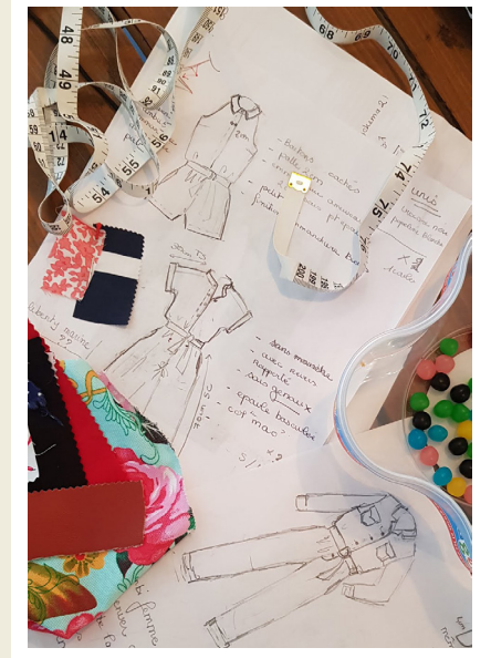
Travaux en cours