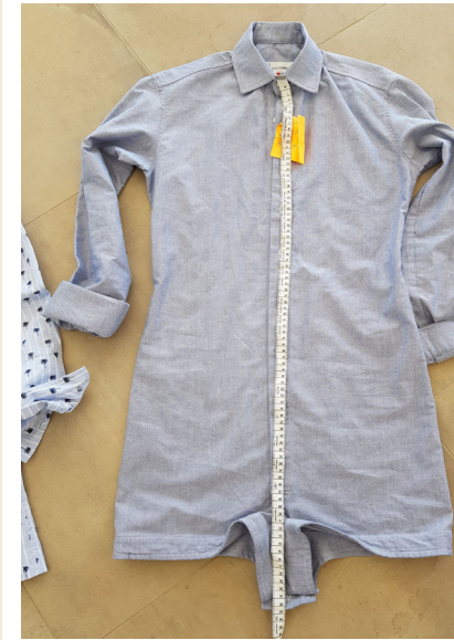
Calchemise enfante La Totale