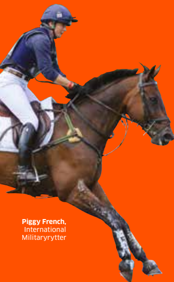
Piggy French, International Militaryrytter

Vetrofen er en naturlig og kraftig antioxidant, som virker hurtigt og sikkert, helt uden bivirkninger både ved kortvarig brug i højere dosering og daglig brug i længere perioder. Vetrofen understøtter kroppens naturlige mekanismer omkring sunde led efter stød og slag og virker allerede 3 timer efter indtagelse, men med størst effekt efter 6-12 timer.