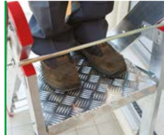
sicuro piano di lavoro 40x40 cm. safe working platform cm 40x40.