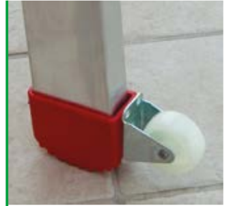
si sposta facilmente e in totale comodità. moves easily and in total comfort.

specifiche tecniche / technical specifications