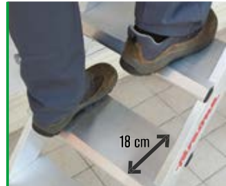
gradino antiscivolo da 18 cm. 18 cm wide non-slip rung.