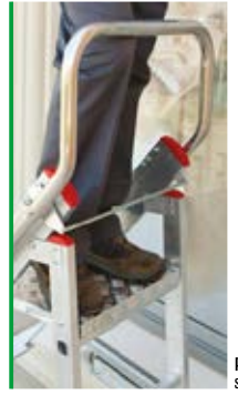
protezione sicura safe protection