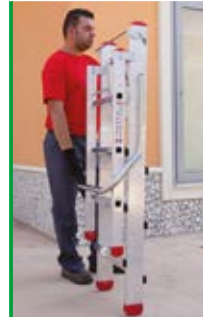
ingombro ridotto per un facile trasporto. compact size for easy transportation.