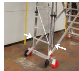
Stabilizzatori chiusi. Closed stabilisers.

Massima sicurezza antiribaltamento con gli stabilizzatori laterali che, una volta chiusi, facilitano lo spostamento della scala. Maximum anti-tilting safety with side outriggers which, once closed, facilitate movement of the ladder.