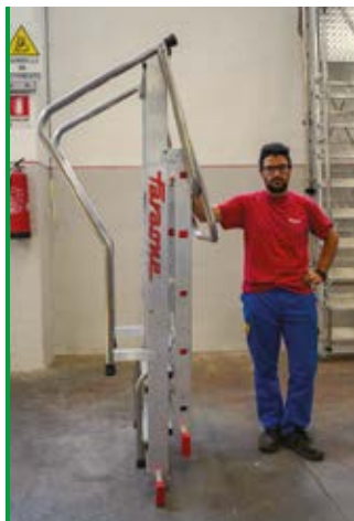
Ingombro ridotto per un facile trasporto. Compact size for easy transportation.

50.000 resistance/cycles EN 131-2: 2017 USO PROFESSIONALE PROFESSIONAL USE