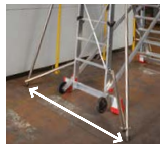
Stabilizzatori aperti. Open stabilisers.