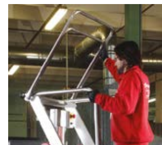
Accesso facile e sicurezza a 360°. Easy access and a 360°.