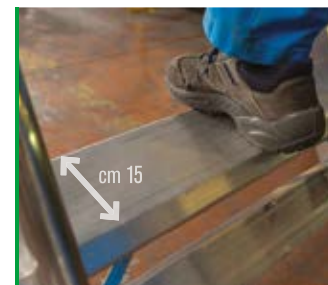
Gradino da 15 cm. per una salita sicura. 15 cm steps ensuring safe climbing.