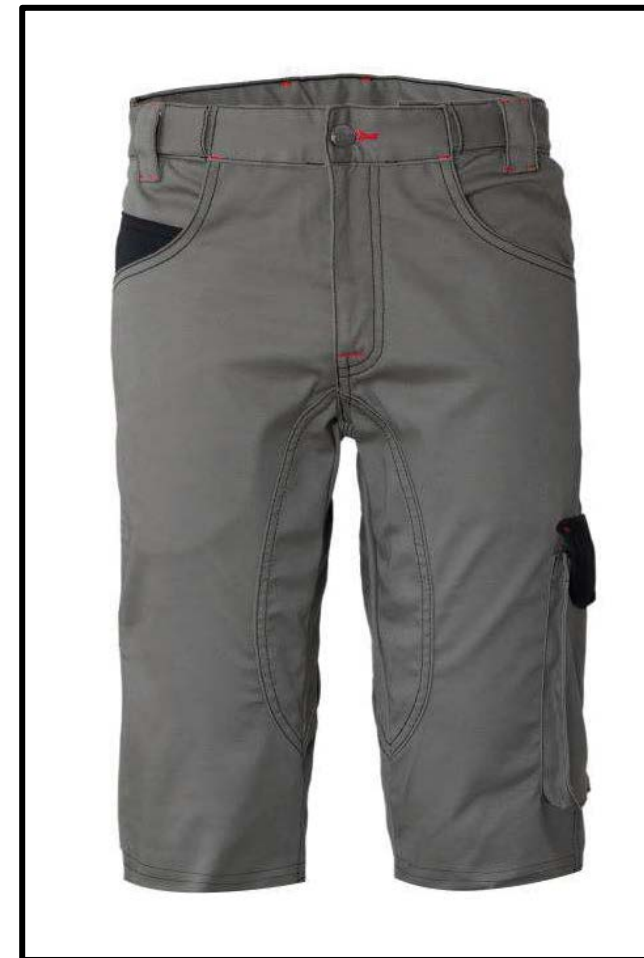
GY – GRIGIO/NERO