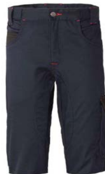
ZX – BLU/NERO