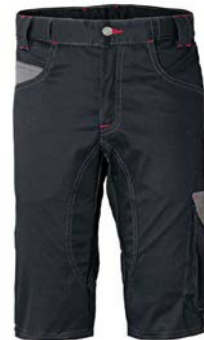
ZY – NERO/GRIGIO