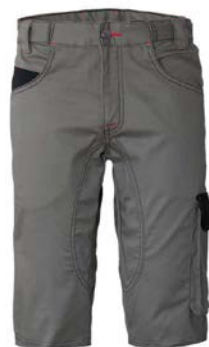
GY – GRIGIO/NERO