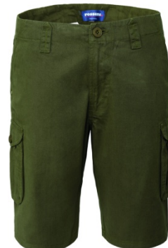
04 - VERDE