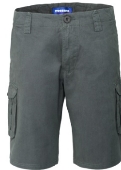
12 - GRIGIO