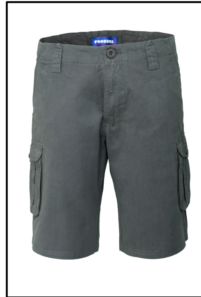
12 - GRIGIO