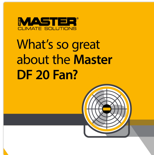
Master DF 20 ventilatore potente, durevole e versatile