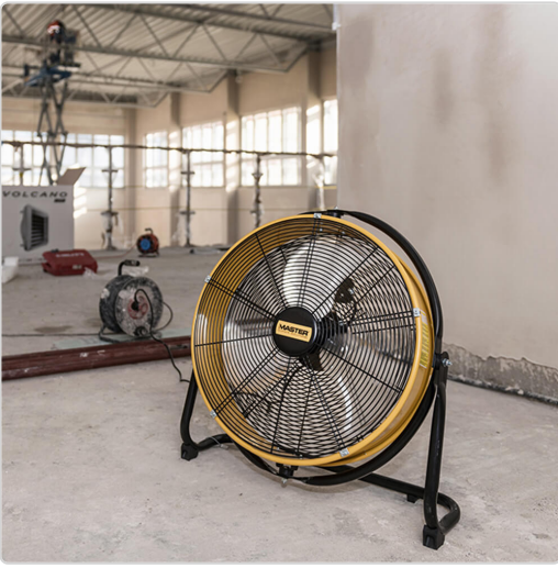
Master DF 20 cantiere