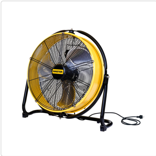
Master DF 20 – ventilatore professionale