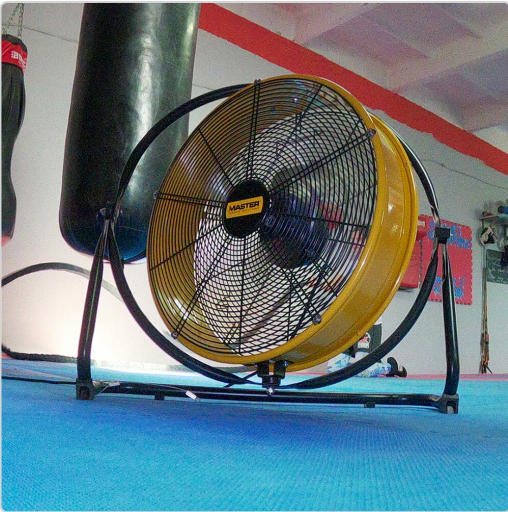
Master DF 20 palestra