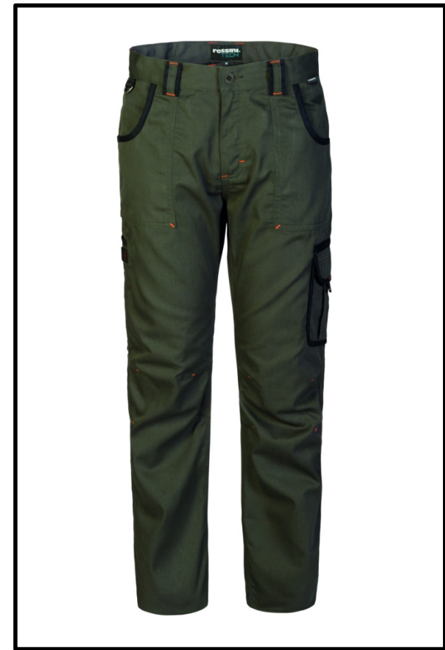
V4 – ARMY GREEN/NERO