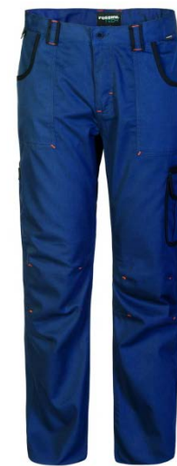
ZX – BLU/NERO