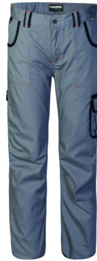
GY – GRIGIO/NERO