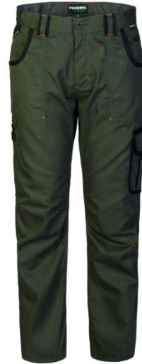
V4 – ARMY GREEN/NERO