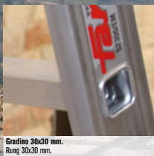
Gradino 30x30 mm. Rung 30x30 mm.

LE IMMAGINI SONO FORNITE AL SOLO SCOPO ILLUSTRATIVO E NON COSTITUISCONO ELEMENTO CONTRATTUALE. THE IMAGES ARE PROVIDED ONLY FOR ILLUSTRATION PURPOSE AND DO NOT CONSTITUTE A CONTRACTUAL ELEMENT