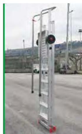
Ingombro ridotto per un facile trasporto. Compact size for easy transportation.