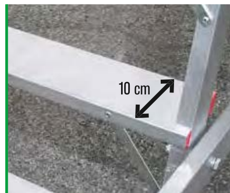
Gradino da 10 cm. per una salita sicura. 10 cm steps ensuring safe climbing.

LE IMMAGINI SONO FORNITE AL SOLO SCOPO ILLUSTRATIVO E NON COSTITUISCONO ELEMENTO CONTRATTUALE THE IMAGES ARE PROVIDED ONLY FOR ILLUSTRATION PURPOSE AND DO NOT CONSTITUTE A CONTRACTUAL ELEMENT