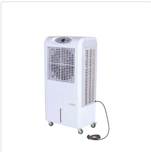
Master CCX 4 – raffrescatori evaporativi

I bioraffrescatori Master raffreddano l'aria utilizzando un semplice processo naturale – l'acqua di evaporazione riduce la temperatura dell'aria. Una pompa preleva l'acqua da un serbatoio e bagna un ampio filtro di cellulosa naturale. Un potente ventilatore aspira l'aria attraverso il filtro. L'acqua evapora dal filtro e riduce la temperatura dell'aria di diversi gradi. L'aria fresca e pulita fluisce nell'ambiente e lo raffresca.