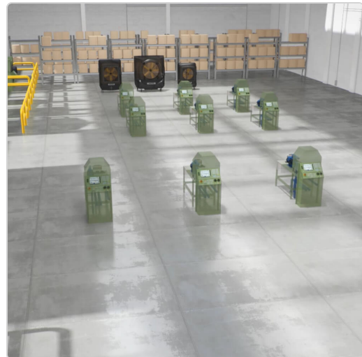
Master raffreddatori evaporativi industriali