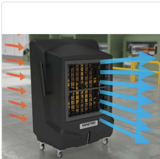
Come funzionano i nostri raffreddatori evaporativi