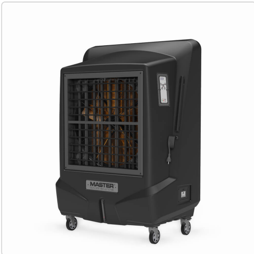
Master BC 221 – raffrescatori evaporativi

Raffreddate la vostra fabbrica, hangar o officina ad un prezzo conveniente. I nostri raffrescatori evaporativi portatili offrono un'alternativa economica ai tradizionali condizionatori d'aria e creano un ambiente di lavoro confortevole per i vostri dipendenti o clienti.